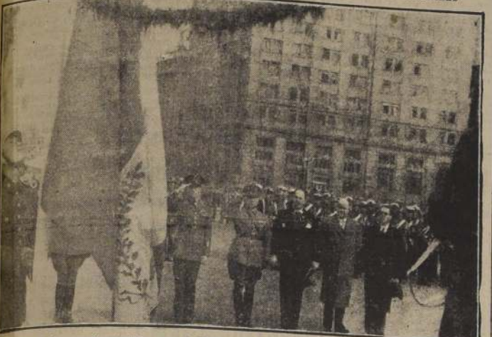
Durante el homenaje rendido por el Embajador de México, Excmo. señor Del Río y Ca-

EL EXCMO. SEÑOR FRANCISCO DEL RIO RINDIO HOMENAJE A O'HIGGINS Y OFRECIO UN BANQUETE EN EL HOTEL CARRERA. — LOS SALUDOS OFICIALES