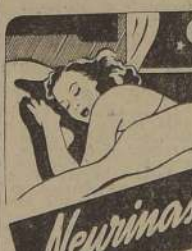
UN SUEÑO APACIBLE

PARIS, 16. (U. P.). — Falleció el general Henri Gouraud, de 78 años de edad, héroe francés de la primera guerra mundial, durante la cual dirigió la expedición de los Dardanelos. Posteriormente fue Alto Comisionado francés en Siria y Gobernador Militar de París.