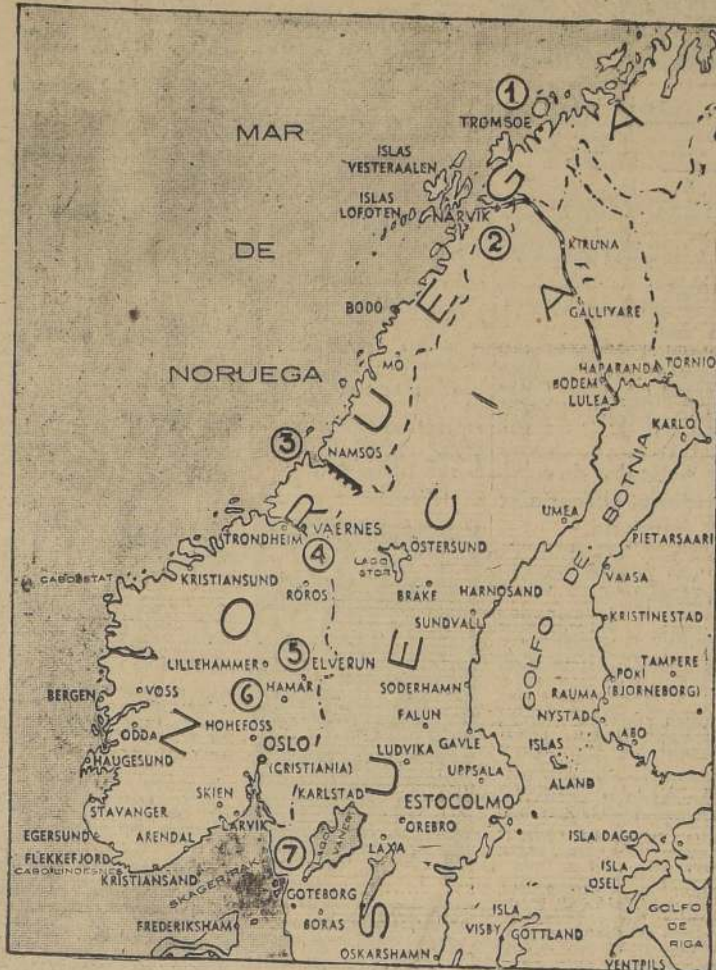
1. Tromsø, hasta donde tratan de llegar los alemanes desde Narvik, y que, según se informa, fueron rechazados por tropas británicas. 2. Se anuncia que los británicos completaron la toma de la línea férrea desde Narvik hasta la frontera sueca. 3. La ciudad de Narvik, punto de desembarco de tropas británicas y en cuyas cercanías han combatido ingleses y alemanes por primera vez en la zona central de Noruega. También se informa que británicos y noruegos establecieron una línea defensiva desde Narvik hasta la frontera sueca. 4. El aeródromo de Vaernes, a 30 kilómetros al este de Trondheim, que ha sido bombardeado por aviones alemanes. 5. Elverum, donde se informa que oficiales británicos se unieron a las fuerzas noruegas que combaten en esas inmediaciones contra los alemanes. 6. La localidad de Hamar, cuya ocupación vuelve a anunciar los alemanes.

Burgin dijo que el equipo fue distribuido en los depósitos del Ejército dentro de unas pocas horas de haber sido dada la orden por el Estado Mayor. Agregó que se está fabricando el equipo necesario para las necesidades actuales y futuras.