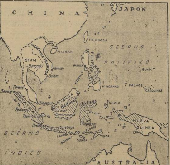
En el presente mapa figuran los territorios cuya posesión ambiciona la corriente militarista del Japon. Ellos son, (además de la China): las Islas Filipinas, la Indochina francesa y las Islas de la Indocina, que con el nombre de Indias Orientales Holandesas, forman la mejor parte del rico y bien organizado imperio que poseen los Países Bajos. Los territorios de Holanda son los que aparecen rayados en el mapa.

Subrayó su opinión de que no debe desprestigiarse el poder de la escuadra japonesa, diciendo que Estados Unidos no debe im-