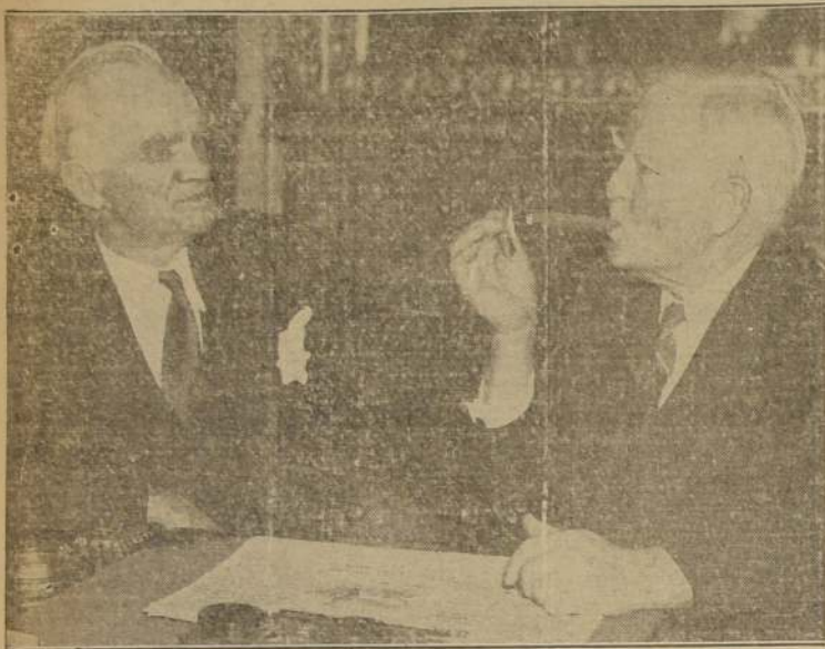
Vemos aquí al presidente de la Cámara de Diputados de Norte América, Sr. Joseph V. Byrns (izquierda), y al vicepresidente John N. Garner, presidente del Senado, mientras discuten los pormenores para la sesión inaugural del Congreso norteamericano el 3 de enero.