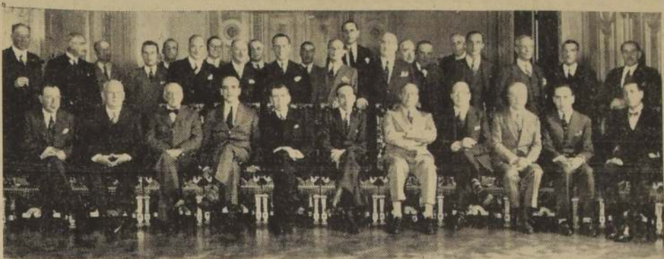
Asistentes a la manifestación que la delegación del Jockey Club de Buenos Aires ofreció antier, en el Club de la Unión, al Directorio del Club Hípico de Santiago.