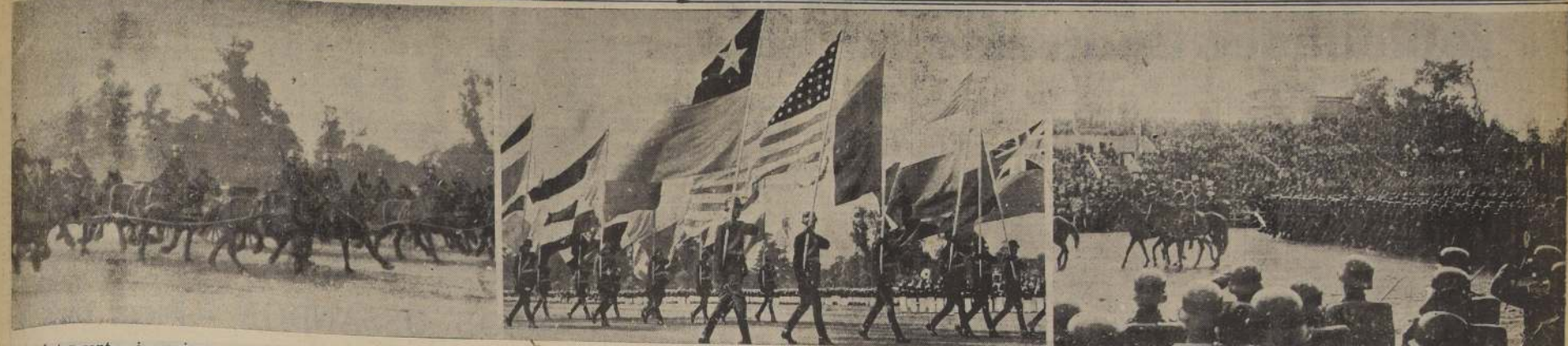
Tres interesantes impresiones tomadas por nuestros fotógrafos durante la Parada Militar de ayer: El Regimiento de Artillería "Maturana" desfila al galope.—Bandas de los países americanos que fueron paseadas ayer por oficiales del Ejército chileno, como una demostración de confraternidad continental.—El Regimiento de Infantería "Bui" pasa ante la tribuna presidencial en forma impecable.