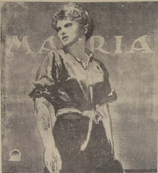
INGRID BERGMAN en el papel de María