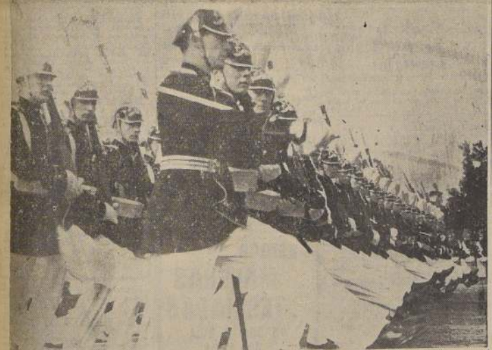
Una Compañía de la Escuela Militar durante el desfile.