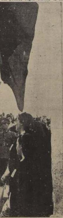
Un cadete de la Escuela Militar y un veterano del '19 proceden al izamiento de la Bandera Nacional, en el Parque Cousiño.

tería, y "Tacna", de Artillería. El popular Regimiento "Bui" desfiló al frente de su Segundo Comandante, teniente coronel