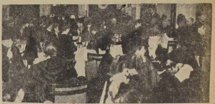
Un grupo de las personas asistentes al Té-Bridge a beneficio de la Cruz Roja Belga, efectuado en los amplios salones del Hotel.