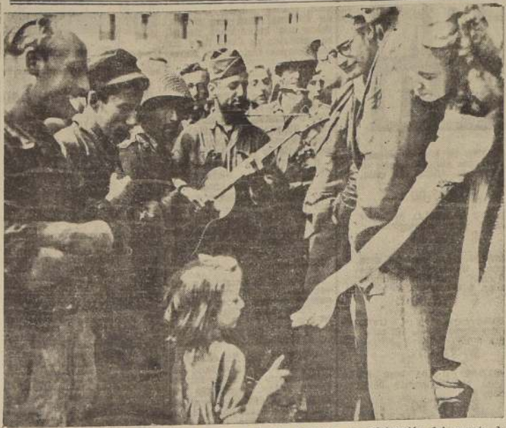
Soldados norteamericanos fraternizando con la población francesa, en celebración del rescate de un pueblo normando.