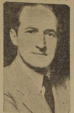
Don José Antonio de Aguirre y Leizaola, Presidente de Euzkadi, pueblo que hoy recuerda la destrucción de su capital, por los invasores nazi.

Franco, otros hacen en sus diálogos y embalsos un significativo silencio en todo lo referente a esta primera parte de la guerra, no faltan quienes tratan ablemente de desvirtuar los hechos y hasta de ensayar más o menos disimuladas defensas de estos criminales ocultos en la sombra. Estos tales, son los más peligrosos nasis hoy día, porque son los únicos que pueden e intentarán escalar los puestos y apoderarse de la política.