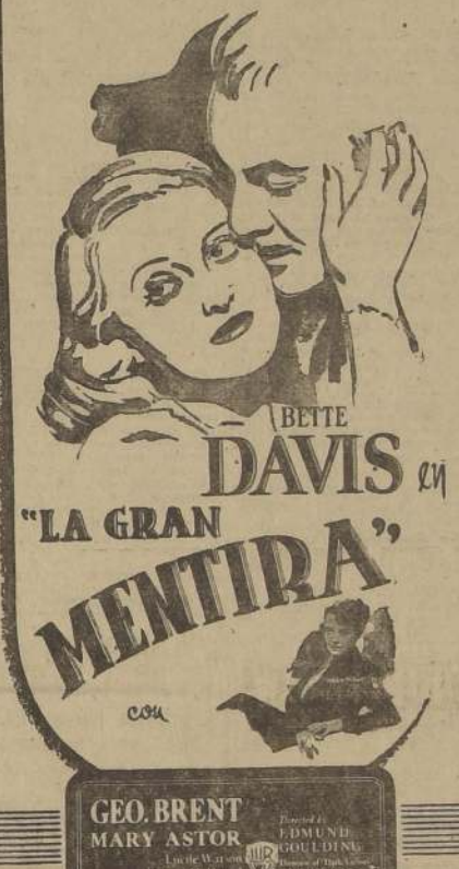
(Sólo mayores; no recomendable para señoritas)

CADA INSTANTE DE EXTASIS DE AMOR LE COSTO INFINITAS HORAS DE AMARGURA A LA HEROINA DE "LA GRAN MENTIRA"