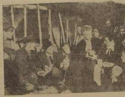
Peró el joven Chopin creció amando demasiado a su patria para entregarse completamente a la música... y oyendo hablar a sus compañeros revolucionarios que planeaban la caída del Zar, se olvidó de que aquella noche celebraba su primer concierto.

(Novelización de la grandiosa película Columbia, del mismo título, en technicolor, con Paul Muni, Merle Oberon y Cornel Wilde, en los roles centrales)