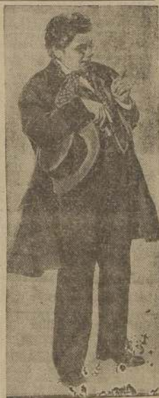
El gran actor Paul Muni se encabeza un brillante elenco en "CANCION INOLVIDABLE", la magnífica película Columbia que será presentada en funciones de préstamo desde el martes próximo en la Sala Cervantes.

Mañana se dará "Celos..." en funciones de beneficio de los fondos para teatro propio de la Sociedad de Autores Teatrales de Chile.