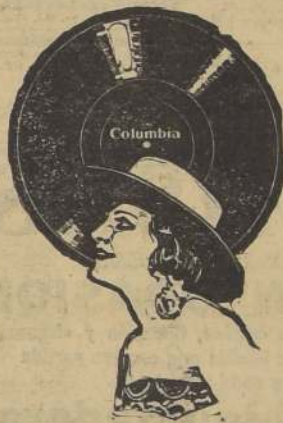
EL UNICO DISCO SIN RUIDO DE AGUJA