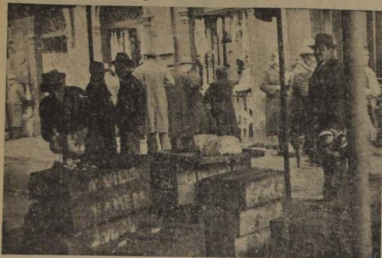
varios puestos expendedores de pescado totalmente inactivos

El público lo buscó afanosamente. — Razones expuestas por los comerciantes