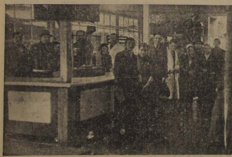
Puesto de venta de la "Industrial Pesquera Pacifico". — Personal desocupado

Dirección General de Obras Públicas DEPARTAMENTO DE ARQUITECTURA Solicítanse propuestas públicas para la construcción de la obra gruesa del Recinto Carcelario de la Cárcel de Lautaro. Las propuestas se abrirán simultáneamente en las Salas de Despacho del señor Intendente de la provincia de Cautín y del señor Director del Departamento de Arquitectura, Morandé 45, Santiago, el día 30 del presente mes, a las 16 horas. Bases y antecedentes en el Archivo Técnico, de 14 a 17 horas. Santiago, 15 de Julio de 1942. EL DIRECTOR DEL DEPARTAMENTO