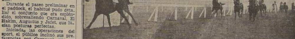
Scarlet, fácil delante de Chaparrón Estruendosa y Barabino, en la cuarta

de afuera llegó Monólogo, que precedió a Kucarro, Bloqueo y Lismaco. Últimos, Caramelo y Burócrata. CUARTA CARRERA La continuación se disputó el premio Mollendo, condicional sobre 1.200 metros, para caballos de 4 años y más, y en donde Scarlet pagó $ 78.90 al derrotar al galope a Chaparrón y Estruendosa. Cuando el lote fue ubicado en tierra derecha, Scarlet actuaba en punta cortada más de 2 cuerpos sobre Chaparrón, en cuya signa se movían Gargal, Barabino, Estruendosa, Quintrileo y los demás como las circunstancias se lo permitían. La pupila del corral Los Tres, al enfrentar las galerías, aumentó el claro sobre sus perseguidores y sin enemigos que le presentaran lucha, llegó a la raya con 4 cuerpos sobre Chaparrón, que la persiguió infructuosamente durante todo el derecho. Tercera, a 1 1/2 cuerpos, se clasificó Estruendosa; cuarto, Barabino; quinta, Cupertina; sexto, Quintrileo y séptimo, Valenciano. Últimos, Casiopea y Ordenado. QUINTA CARRERA El handicap de fondo, premio