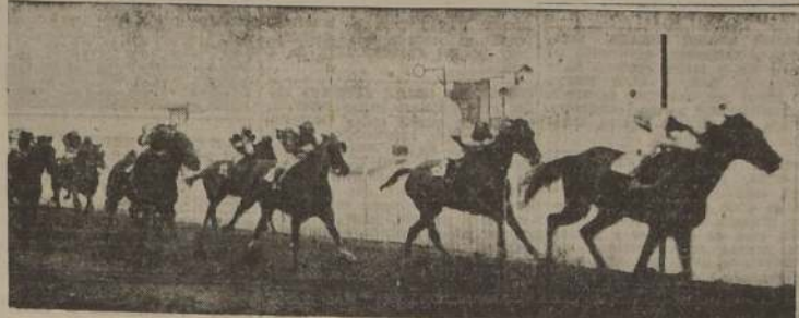
Terma reparte $ 130.70 al imponerse sobre Live pool, Oleage y Camperita en la prueba de clausura