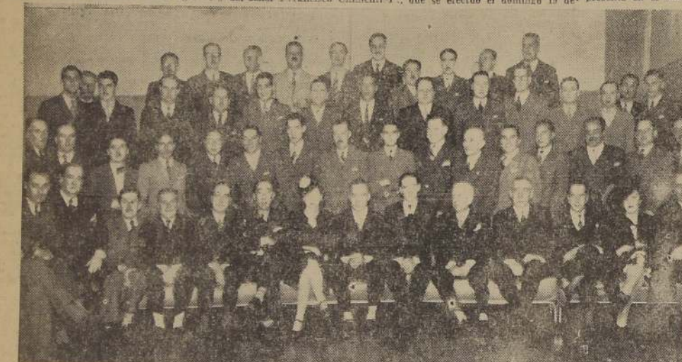
Con una comida especial fue celebrado el 25 aniversario de la Sociedad de Empleados de Bancos y Cajas. Especialmente invitados asistieron los Gerentes de Instituciones Bancarias y Cajas de Seguros. Se sirvió en el Salón de Recepciones del LUCERNA.