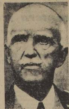
S. M. Victor Manuel III, Rey de Italia, cuyo nacimiento se celebra hoy.