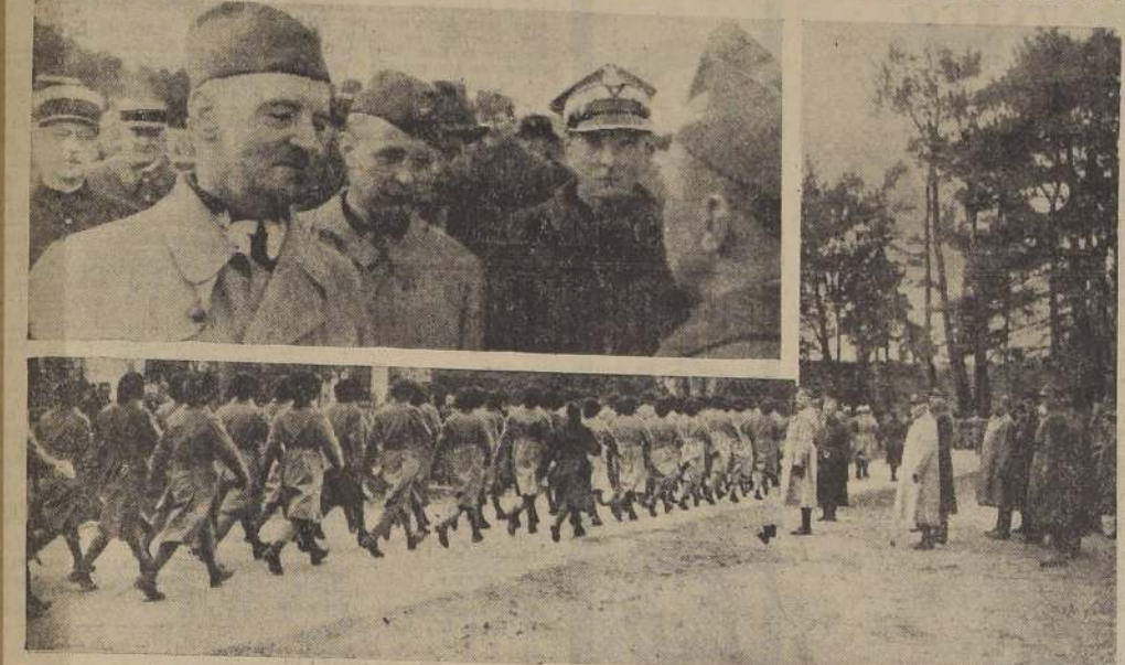
Tropas del nuevo ejército polaco, constituido en Francia, para luchar al lado de los aliados contra los alemanes. Las tropas son revistas por el general Sikorsky, jefe del ejército. — Arriba, Sikorsky conversa con oficiales franceses.