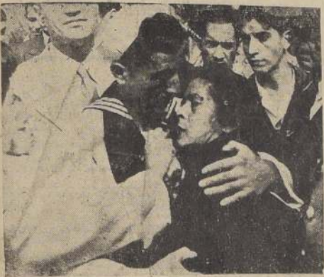
Madre e hijo, en abrazo fraternal

La llegada a Valparaíso de los restos de las víctimas del siniestro que hizo sucumbir a la fragata escuela "Lautaro" y de los sobrevivientes de esa desgracia nacional, dio motivo ayer a escenas de intensa emoción, a cuadros patéticos, que actualizaron esa dolorosa tragedia que sembró el dolor y el duelo en numerosas familias y que, a su vez, a nuestra gloriosa Marina de Guerra, a servidora que era toda una promesa para la Patria y una unidad en que estaban formándose los hombres que iban abrazados la noble carrera del mar.