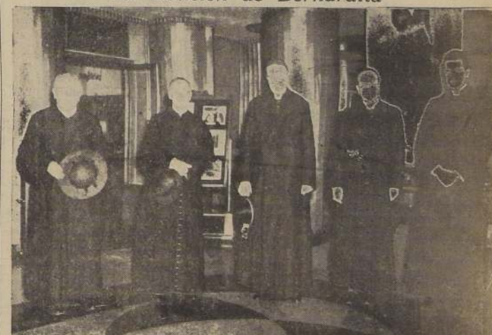
Monseñor José María Caro, acompañado del Nuncio Apostólico de Chile y de altos jefes de la Iglesia chilena al momento de retirarse de la Sala Cervantes, donde les fue exhibida privadamente la extraordinaria producción 20th. Century Fox, "La Canción de Bernardita".

Una de las más extraordinarias producciones que pronto será presentada al público, será sin duda la magnífica 20th. Century Fox, "La Canción de Bernardita", film basado en la obra de Franz Werfel que ha obtenido uno de los más rotundos éxitos.