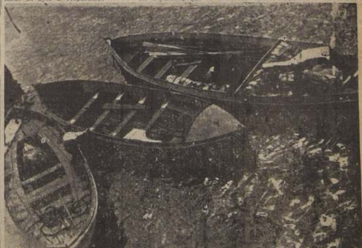
Los tres botes en los cuales se salvaron los doscientos veinte tripulantes de la fragata "Lautaro". Cada uno tiene capacidad para treinta o cuarenta hombres. En esta ocasión fueron ocupados hasta por setenta. Muchos de los naufragos estuvieron afebrados a maderos o puertas que se lanzaron al mar, pues los botes de proa se quemaron en los primeros momentos.

La delegación que preside el Excmo. señor Ríos llegará a Puerto poco después de las 10 horas de hoy. La ceremonia de los funerales se iniciará a las 10.30 horas.