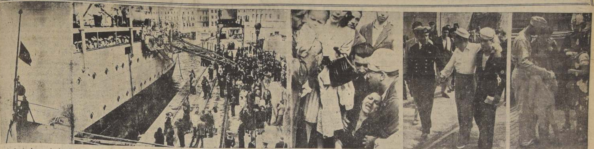
La insignia de mando del Comodoro de la División de Submarinos, a media asta en la popa del Buque-Madre "Araucano".— Familiares, periodistas y público en el muelle, esperando el momento de subir a bordo.—Emocionantes escenas familiares.— Uno de los heridos es llevado al Hospital Naval.