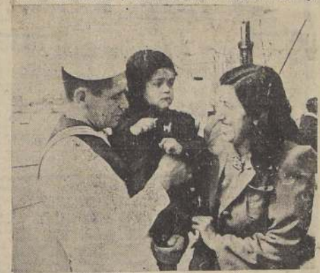
Sobreviviente con su esposa e hijo

ese barco una jornada difícil de reflejar con palabras y frases. Luego que subieron a bordo los jefes navales, se permitió el acceso de los familiares de los tripulantes de la "Lautaro" y de los deudos de las víctimas del fatídico siniestro.