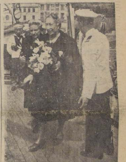
Ofrendas florales para las víctimas de la fragata "Lautaro"