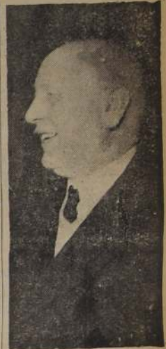
El distinguido escritor, don Fernan- do Santiván, que hoy recibirá el Premio Nacional de Litera- tura.