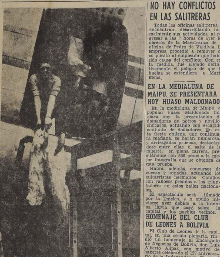
ORDENES DE MAGAÑALES AL NORTE. En su servicio inaugural de carga aérea dentro del territorio, la Compañía Chilena "Lyon Air Ltda." trasladó en un bi-motor Curtiss, el grábado, persona artículos alimenticios para el Norte Chico. En el consumo en Vallemar. En esta ciudad, los ordenes forjizados para la tancia del día, dio la bienvenida a los pilotos, destacando la importancia de la aviación en el oportuno beneficio para la economía, especialmente en lo que respecta al abastecimiento de mercaderías de primera necesidad.