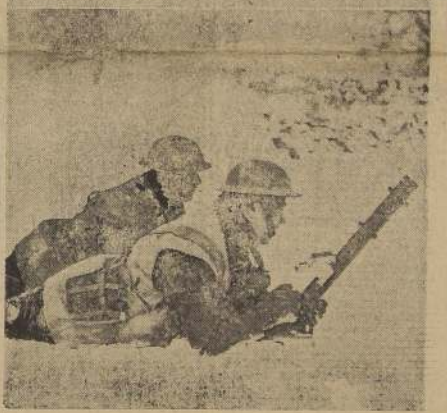
Fuerzas expedicionarias de Gran Bretaña destacadas en la primera línea de fuego en la tierra de nadie, que separa las obras fortificadas que guardan las fronteras de Francia y Alemania. (Fotografías hechas por vía aérea, especialmente para LA NACION).

Los Estados Unidos deben conceder préstamos razonables a la América Latina como buena práctica comercial