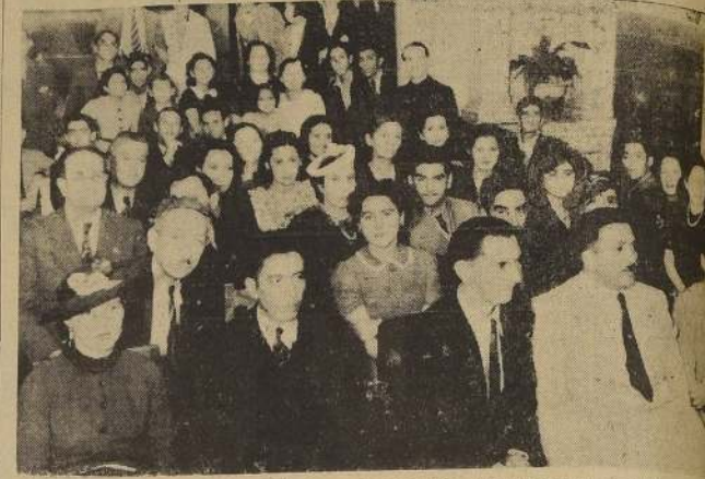
Aspecto de la asamblea solemne realizada por la Federación Cultural Obrera de Chile, en conmemoración de su 12.º aniversario, acto que alcanzó lucidos caracteres.

Se realizaron con todo éxito su asamblea solemne e inauguración de su 12.º aniversario. — Delegados y oradores. — Actos de hoy y mañana