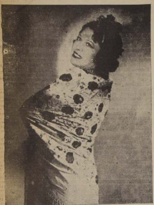
Mezzo soprano Conchita Velázquez, que ha cantado "Carmen", de Bizet, docientos ochenta y seis veces, y cuya interpretación personalísima le ha valido clamorosos éxitos en los principales escenarios líricos del mundo. — Esta ópera la cantará nuevamente hoy, bajo la dirección del célebre maestro Wolff