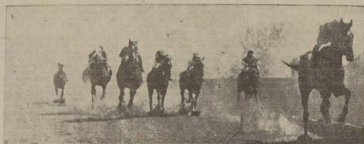
Crucero al galope delante de lante de Fadeiro, Instantánea y Gergovia

Nuestro recomendado Tate Callaito en fácil acción delante de Valentiano, Morfinomano y Tacora