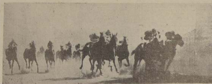
Baquedano logra un nuevo triunfo, al dar cuenta a Chiflita, Montreal y Don Fausto