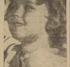
Shirley Temple, cuya última pe- lícula "El Pájaro Azul" se cono- cerá pronto en nuestras pan- tallas.

Según manifestara la señora Temple, Shirley continuará asis- tiendo a la escuela privada don- de se educa, pero posiblemente se presentará algún día en el radio, y dentro de un año por teatro.