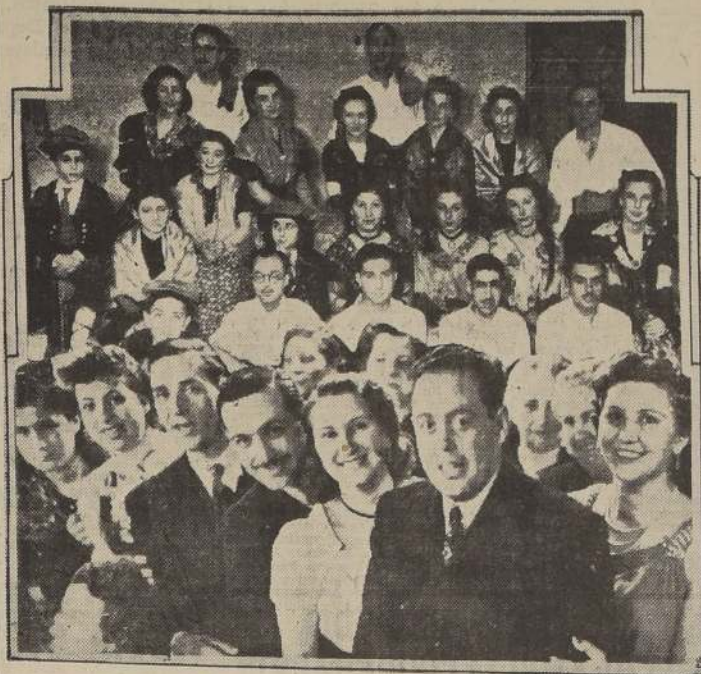
Participantes en el baile "la sardana" luciendo sus trajes típicos catalanes. Un grupo de asistentes a los actos sociales en el Centro Catalán.

Ayer culminaron las festividades organizadas por el directorio del Centro Catalán, en celebración del "Día de la Mujer Catalana". Este día, que se celebra en el pueblo catalán, rico en costumbres y tradiciones, ha sido declarado día de la mujer catalana por el gobierno de la República. En esta ocasión, el directorio del Centro Catalán organizó una serie de actividades que culminaron ayer con un banquete de confraternidad.