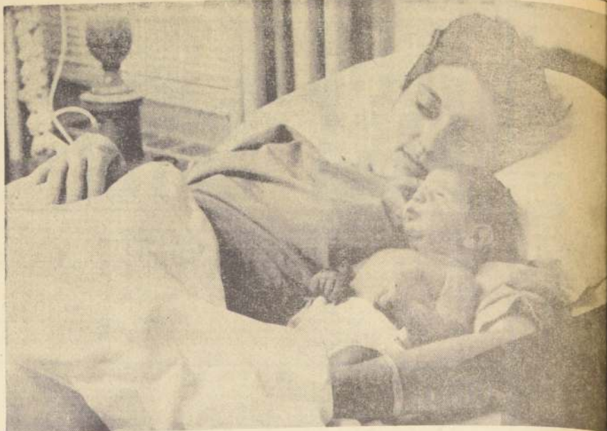
BETHESDA.— Lynda Robb, hija del Presidente de los Estados Unidos, Lyndon Johnson, aparece aquí con su hija, nacida el recién pasado 23 de octubre. El nacimiento tuvo lugar en el Hospital Naval de Bethesda.

bre las misiones de los oficiales de ese organismo. Indicó que la espía, conocida también bajo el nombre de clave de "Viola", es una mujer divorciada, que estuvo trabajando en favor de los comunistas durante todo un año desde mayo de 1967. Añadió que recibió 4.300 marcos (1.075 dólares) en efectivo y el anillo completo de un dormitorio calculado en 3.000 marcos (unos 750 dólares). Viola fue arrestada el 7 de septiembre último y liberada el 16 de octubre en espera del resultado de la investigación. Por otra parte, hoy fue anunciado el séptimo caso de suicidio en Bonn en lo que va del mes, en aparente relación con el caso de espionaje. Un vocero del Ministerio de Economía dijo que una mujer que abandonó su cargo en ese departamento hace un año, se dio muerte "hace pocas semanas".