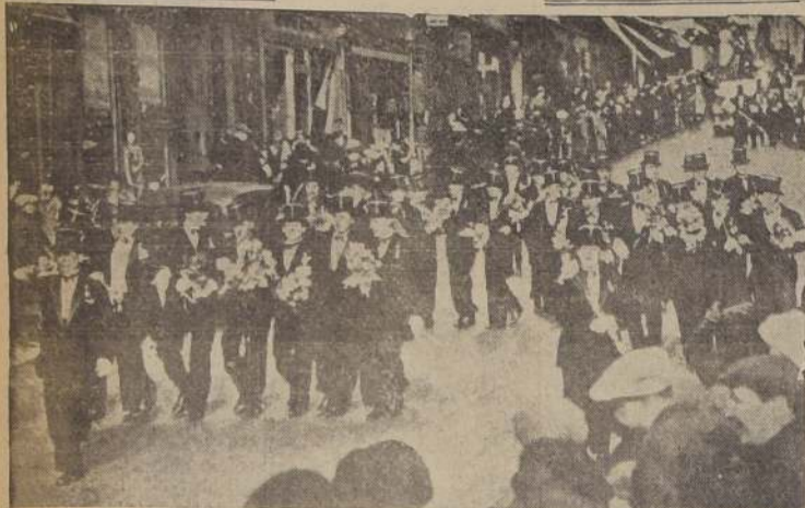
Alegres, los jóvenes de Villefrance, en la Kiviera, celebran el día en que han sido llamados a prestar sus servicios en el ejército francés