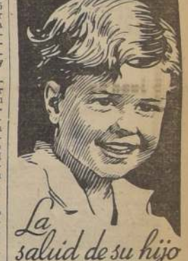
La salud de su hijo

ROMA, 28 (U. P.). — La invasión de Cataluña por el general Franco ha sido recibida con la mayor satisfacción en los círculos políticos y periodísticos, pues se cree que el éxito continuado de los nacionalistas marca la etapa decisiva de la guerra civil en la República española. Es particularmente grato a los italianos la prospectiva de voluntarios italianos entre las tropas victoriosas de Franco. "Lavoro Francese" celebra el heroísmo de los legionarios, cuya última ofensiva al Sur del Ebro constituye una de las más espléndidas acciones en que el coraje y el heroísmo de los legionarios han sido mejor revelados. "Su avance en el frente que le ha sido designado fue fulminante y condujo a la posesión de la poderosa defensa del enemigo." "Hoy he escrito una nueva página gloriosa de los legionarios en España." "Su victoria ha constraído la sangre de los soldados de muertos y heridos."