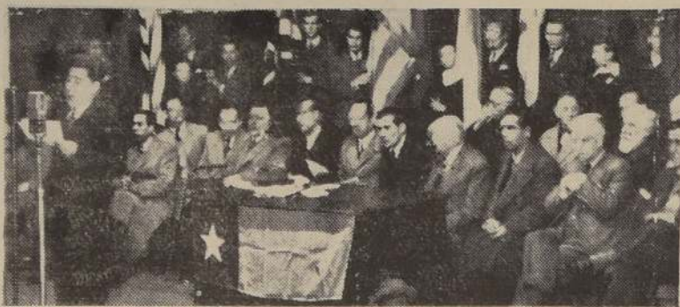
La mesa directiva de la concentración efectuada ayer en el Teatro Colón

La reunión se prolongó por espacio de más de tres horas y