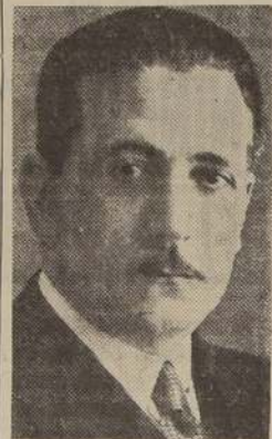
Excmo. señor Alfredo Baldomir, Presidente de la República del Uruguay