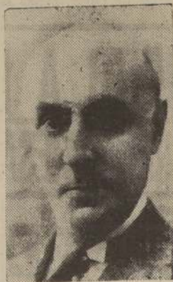
Excmo. señor Carlos de Santiago, Ministro del Uruguay en Chile

La República del Uruguay cuya independencia fue declarada el 25 de agosto de 1825, celebra hoy su 116.º aniversario nacional.