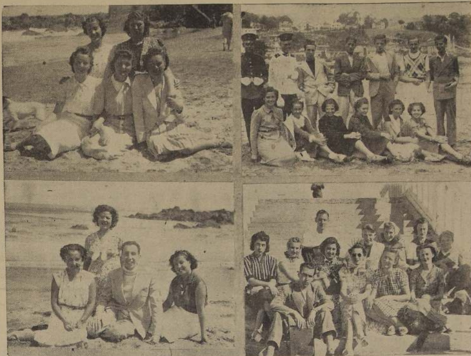
Diversos aspectos del veraneo en Cartagena cuyas playas se ven muy concurridas por conocidas familias de la capital.