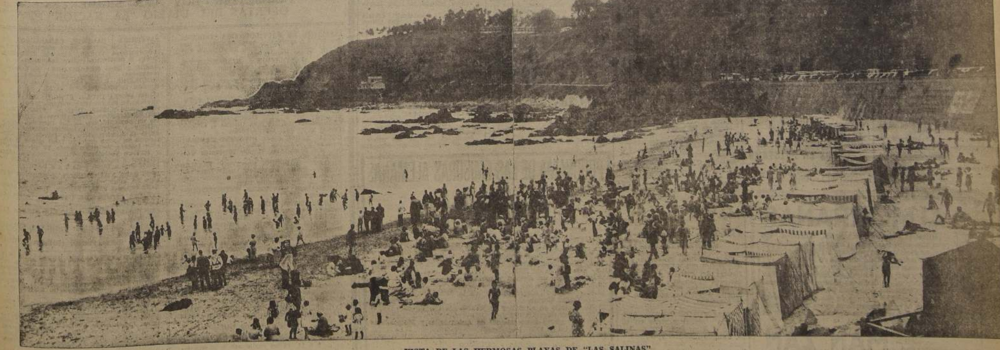
VISTA DE LAS HERMOSAS PLAYAS DE "LAS SALINAS"

La escalinata central del Casino lleva a un amplio hall, a cuya izquierda se abre un bar americano, moderno, acogedor y lleno de rincones íntimos. Viene