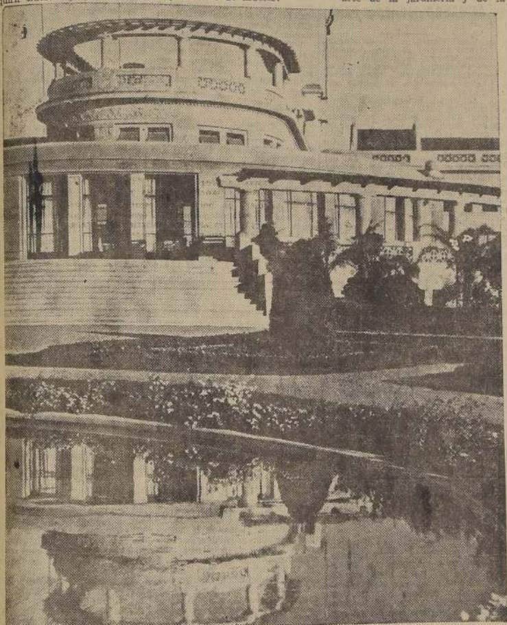
Vista parcial del Casino Municipal

La escalinata central del Casino lleva a un amplio hall, a cuya izquierda se abre un bar americano, moderno, acogedor y lleno de rincones íntimos. Viene