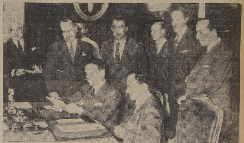
Durante la firma de la prórroga del "Modus Vivendi" entre Chile y Estados Unidos