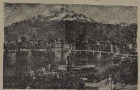
LUCERNA, es una de las más bellas ciudades de Suiza. Queda sobre el lago que lleva su nombre, y es visitada por miles de turistas que llegan de todas partes del mundo.

Para toda Suiza es, sin duda, de interés saber cómo funciona esta vigilancia de las vías férreas que atraviesan nuestro país de Sur a Norte. El Comando del ejército sigue con suma atención la evolución de los eventos militares. Acostumbrado a contar con todas las eventualidades, no ha tardado un solo día para crear un dispositivo de seguridad para prevenirse de cualquiera sorpresa, no importa de qué lado viniera.