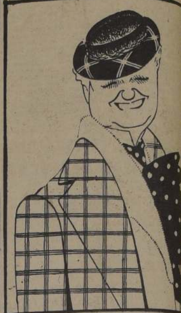
GENEVIEVE TABOUI, la periodista francesa, autora del libro "Me llamaban Casandra", traída desde ayer en Chile.