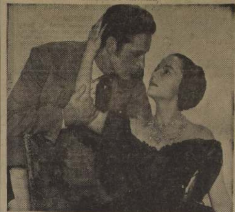
Olivia de Havilland y Richard Burton, en una dramática escena del drama "MI PRIMA RAQUEL", que el jueves estrena el cine REX, y cuyo libro ha causado sensación en el mundo entero.

Basada en la obra escrita por la autora de "Rebecca", DAPHNE DU MAURIER