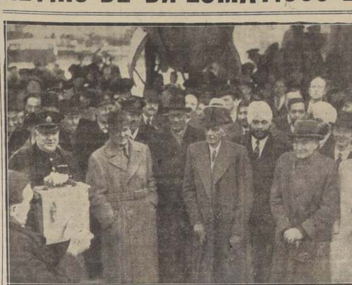
LONDRES.—El virrey de la India y los líderes indios llegan a Londres. El Gobierno británico invitó a los líderes laboristas a celebrar conversaciones para tratar de buscar una solución del problema de la India. La foto nos muestra al virrey, Lord Wavell (a la izquierda, de abrigo claro); Jinnah (de bastón); Sardar Baldev Singh (de turbante blanco), y al Pandit Nehru, a la extrema derecha, a su llegada al aeropuerto de Heathrow.