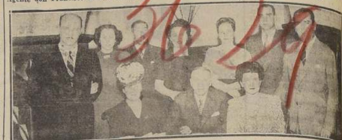
Comida de clausura del campeonato de mus 1946