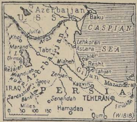
La provincia semiautónoma de Azerbaijón persa es una gran meta rodeada por elevadas montañas, situada al noroeste del Irán. Limita al norte con el Azerbaijón ruso y al suroeste con el Kurdistán e Irak. Su capital es la ciudad de Tabriz.

Ghassem dijo hoy que la invasión estaba destinada a permitir que las tropas del Gobierno central fiscalicen las elecciones, y expresó: "A menudo he afirmado mi buena voluntad hacia Azerbaijón. Como Azerbaijón es parte del Irán, las tropas deben entrar y vigilar las elecciones como en las demás provincias iraníes. Por lo tanto, he ordenado a las tropas que se dirijan hoy a Mianeh y a la zona de Zarcham, para evitar incidentes desagradables. Las tropas del Gobierno central in-