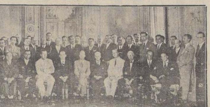
Parte de los asistentes al banquete en honor del príncipe Bertil