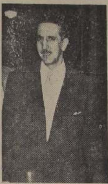
ESPERA CONFIAO.— Rafael Tarud, ex-Ministro de Economía y Comercio, aguarda confiado y tranquilo la votación de la Cámara. Sabe que la justicia está de su parte, y que sus acusadores de hoy, serán los acusados de mañana.

La pasión política es mala consejera. Y los señores parlamentarios deben meditar seriamente que por sobre los intereses políticos del momento está el interés superior del país, el afianzamiento de nuestras instituciones fundamentales y el porvenir de nuestra democracia.