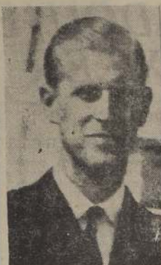
DUQUE DE EDIMBURGO

OMUNES ACEPTAN COMO REGENTE A DUQUE DE EDIMBURGO