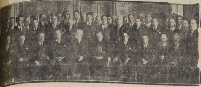
Al almuerzo ofrecido al conde Sforza, en el Club de la Unión, por la Asociación Italo-Sudamericana.

BANQUETE DE LA ASOCIACION ITALO-SUDAMERICANA