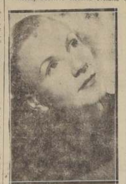
Madeline Lamaitre, una de las principales actrices del conjunto francés que se presentará en breve en el Municipal.

el Teatro Odeón, de Buenos Aires, y que realiza una gira por América, bajo los auspicios de la Asociación Artística Francesa, nuestros círculos sociales