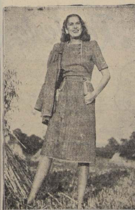
Vestido y chaqueta en tweed café y blanco, adornados de amarillo muy vivo.