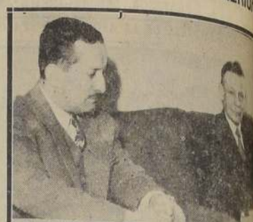
El señor Siegfried con un redactor de LA NACION

SUS OPINIONES SOBRE LA INFLUENCIA DE LOS INTELECTUALES DE SU PATRIA EN LA CIVILIZACION DE LOS PAISES DE ESTE CONTINENTE