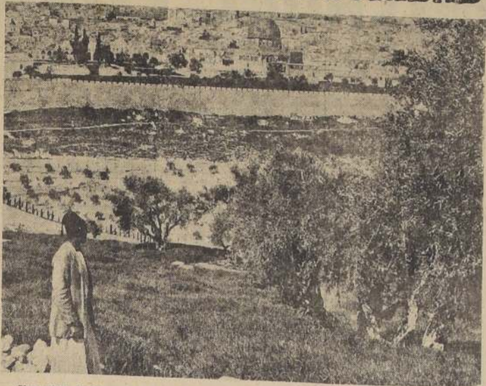
Una vista de Jerusalén desde las afueras de la ciudad

recuciones mi- res para pre- represalias ejército clan- destino calma de mal rio en Haifa