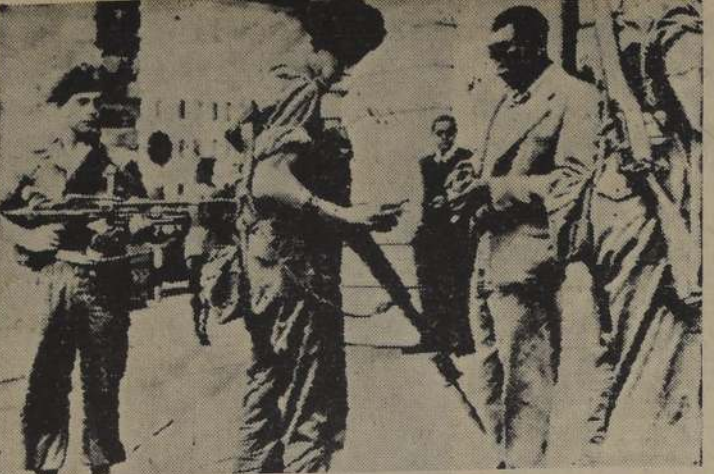
NAIROBI (Sud Africa).— Tropas británicas controlan las tarjetas de identificación de los africanos en las calles de Nairobi, mientras aumenta la inquietud debido a las actividades peligrosas de los Mau Mau. Las tropas han tomado los puestos de la policía local, en vista de que esta no ha podido dominar la situación.