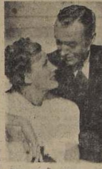
Irene Dunne y Charles Boyer, forman la pareja romántica de "Dos corazones", que el Teatro Central exhibe desde hoy en sus funciones habituales.