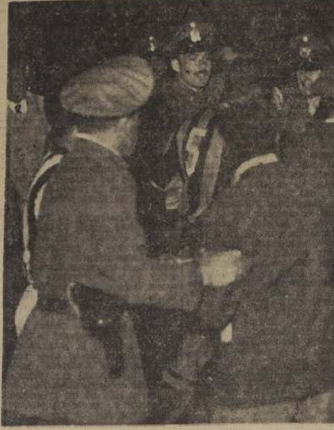
Sablazos, pufetes a granel, insultos y de un cuanto hay, hubo en el bullado match PEÑAROL-BOTAFOGO, finalizado padamente y cuando ganaban los cariocas 1 por 0. El grabado nos muestra un momento álgido del lo, en el que por no se confirma que el fútbol profesional tiende a hormanar a los pueblos... frase tan socorrida.

En encuentros amistosos de fútbol, el Deportivo Lacunza venció al "Central Amigo", por 3-0 con su primer cuadro, y por 2-1 con el segundo. El Lacunza celebrará reunión general de socios hoy, a las 21.30 horas, en su local.