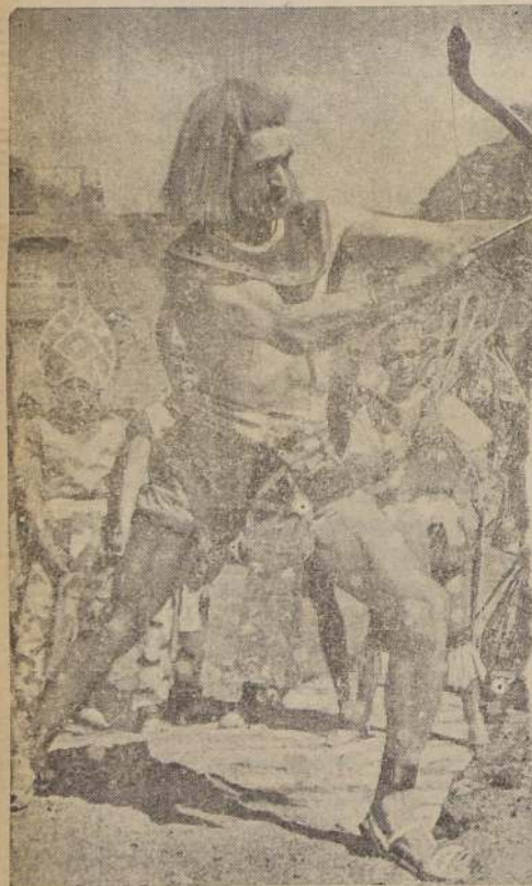
Durante algunas festividades tradicionales mexicanas, se vieron caracterizaciones como la que muestra el grabado. De esta manera México rinde un homenaje a sus antepasados.