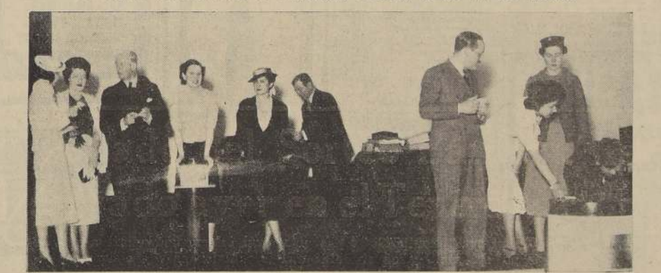
DURANTE EL ACTO DEL SORTEO