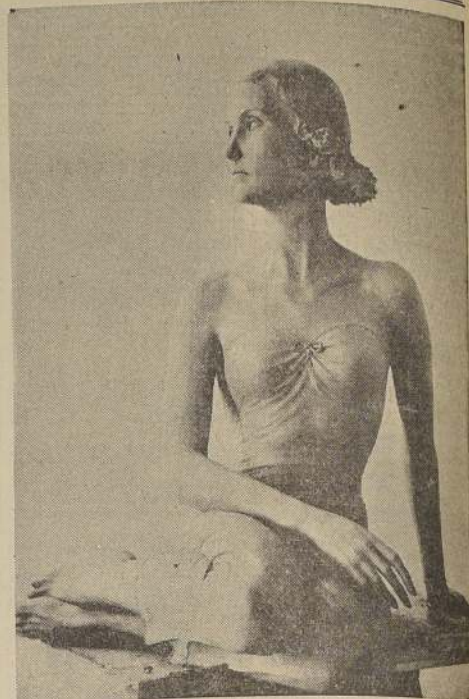
Escultura de Antonio Berté, que representa a la Condesa Hagnitz Reventlow, casada recientemente. La Condesa, cuyo nombre de soltera era Bárbara Hutton, es considerada como la mujer más rica del mundo.