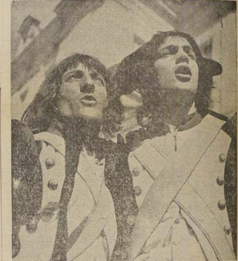
Una escena de la película francesa "La Marseillaise", dirigida por Jean Renoir que se está filmando actualmente.