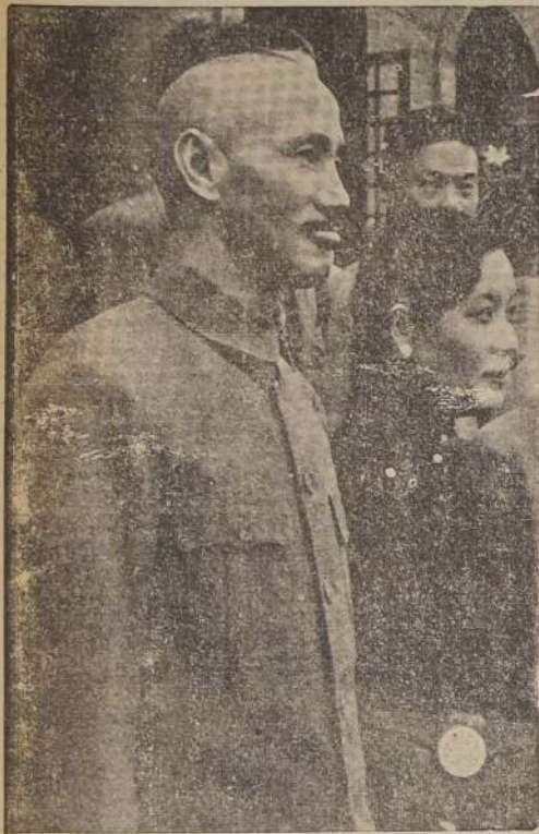
El generalísimo chino, Chiang-kai-shek y su esposa, Mei-Ling, cuya labor en el Gobierno es de incalculable valor.