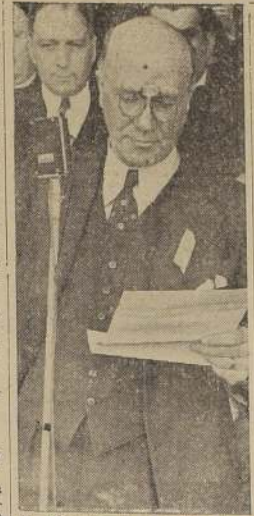
El Ministro Sr. Valdés Fontecilla hablando, a nombre del Gobierno, durante la inauguración del torneo de fútbol de Osorno.

EL MINISTRO DEL INTERIOR LLEGARA HOY DE TALCA Y EL DE FOMENTO CONTINUA VISITANDO LA REGION DE RIO BUENO