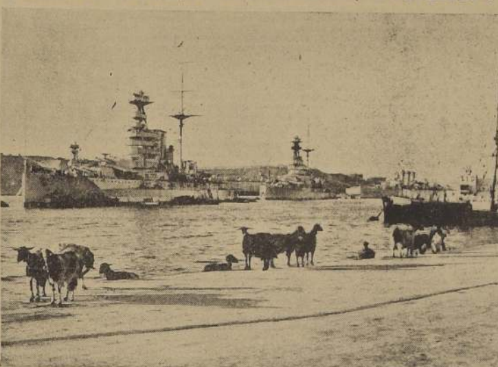
Vista de la isla de Malta.

WASHINGTON, 13.— (U. P.).— El mariscal del aire británico Sir Hugh Pugh Lloyd declaró que Malta será el punto de partida para una invasión de Italia. Dijo que la isla fué la llave de los éxitos británicos en la Libia el año pasado, pero que von Rommel más tarde llevó por la vía aérea una gran cantidad de material desde Creta para su ofensiva, que tan buenos resultados le dió.