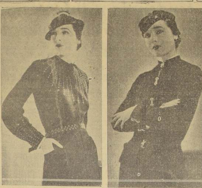
Traje sastre de Lelong, de jersey azul marino. La chaqueta se prende con broches dorados. Sombbrero de Rose Descat. Traje de tarde de lana negra adornado con piqué blanco. Una tira de Modelos de Lelong.