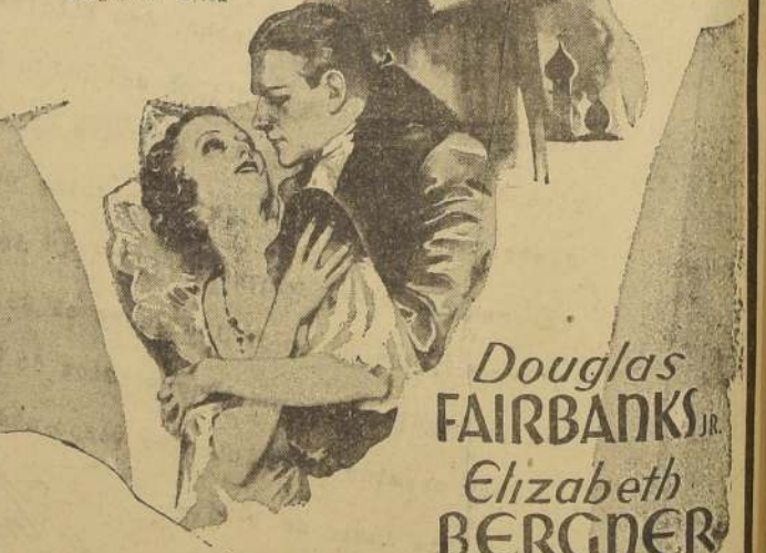
Douglas FAIRBANKS Elizabeth BERGNER

(No recomendable para señoritas) Programa Terra