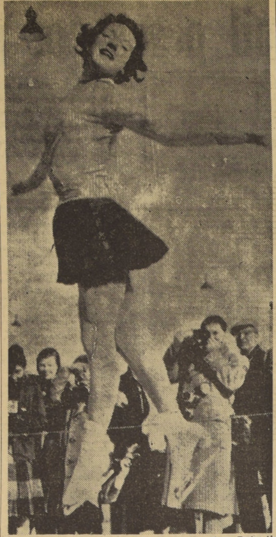
CAMPEONA DE PATINAJE. La joven norteamericana Tenley Albright, de Newtown, Massachusetts, ganadora del campeonato mundial de patinaje para damas, efectuado en Viena, ejecuta un artístico salto, aumentando el mayor puntaje en el primer día del torneo.

Se desprende de lo dicho, en consecuencia, que la fusión ya es un hecho, y se pone término así a una situación que se prolongó demasiado.