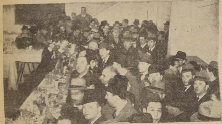
Parte de la concurrencia en el cocktail ofrecido por la empresa del Teatro Colón, con motivo de la inauguración de esta nueva sala.

Con la inauguración del moderno Teatro Colón, efectuada anoche, cuenta la ciudad de Santiago con otra nueva y hermosa sala de espectáculos, ubicada en el populoso barrio San Pablo.