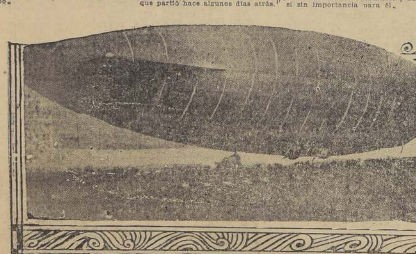
El dirigible "Italia", en que el

terminado número de personas, algunas de las cuales tenían que hacer experimentos y observaciones de carácter científico. El problema aeronáutico era, por lo tanto, el que primaba y Nobile lo resolvió satisfactoriamente. Lo demás, puede decirse, era secundario y casi sin importancia para él.