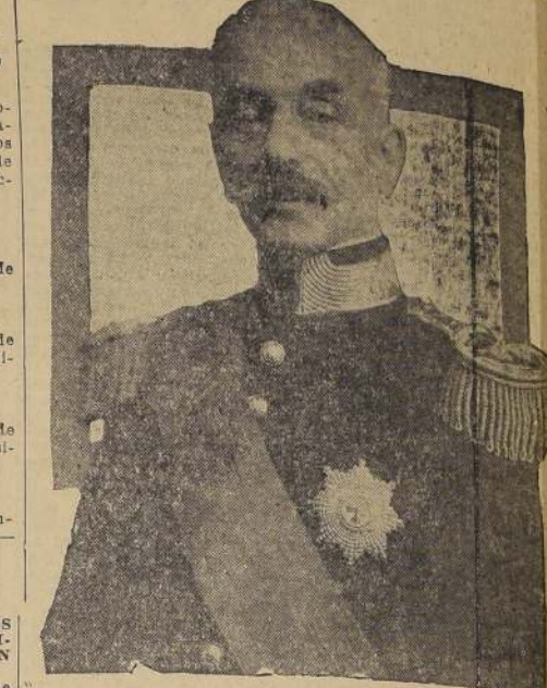
General Oscar Carmona

LISBOA, 16. — Junto con haber tomado posesión de su alto cargo, acaban de realizarse las ceremonias de la proclamación del Presidente de la República, general señor Oscar Carmona, quien fué elegido últimamente por más de seis cientos mil votos.