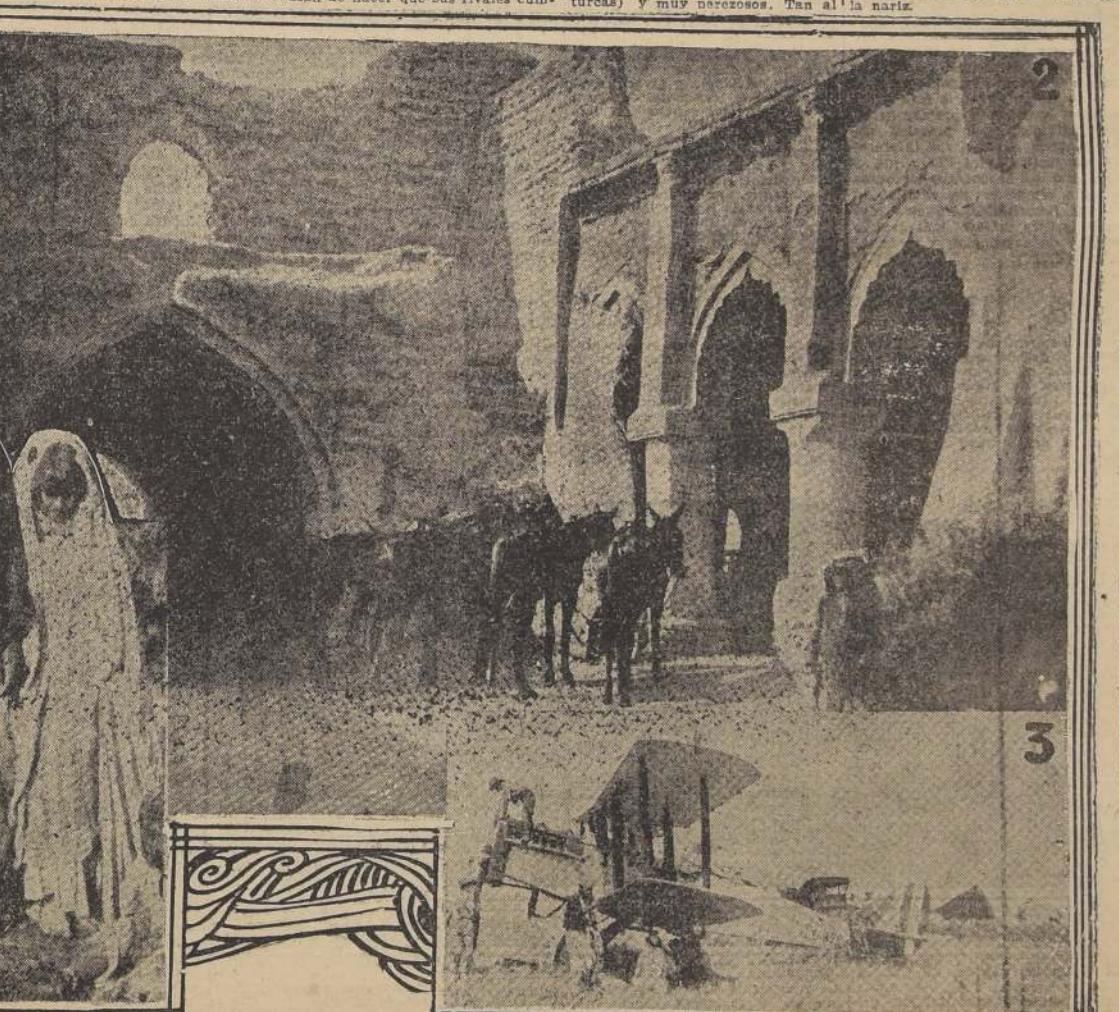
1. Dos figuras típicas: Una madre y su hija, de la tribu de los Muntafik; la riqueza de cuyos habitantes ha despertado en más de una ocasión la codicia de los wahabíes. — 2. Soldados de S. M. Británica: Un avión de bombardeo de la Royal Aerial Force enviado recientemente al Iraq. Es éste un valioso medio de mantener el orden y para las comunicaciones en el país. — 3. Una posada en una ciudad del desierto: Un café árabe o khan, en Zobeir, la ciudad-mercado amurallada del desierto, a la que van a hacer sus compras los beduinos. Su arquitectura tiene la característica de casi todas las ciudades de Hedjaz, Nedj y Koweit: los arcos.