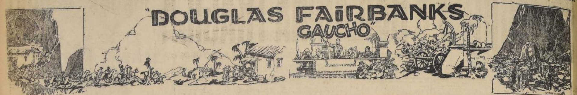
EN EL ESMERALDA TRABAJARA CORONA DESPUES DE LA PELICULA Y EMPEZARA A LAS 6 Y 9.20 EN PUNTO

HOY Platea... $ 3.20 Galeria... $ 0.80 SETIEMBRE, CARRERA, ESMERALDA; BRASIL y O'HIGGINS