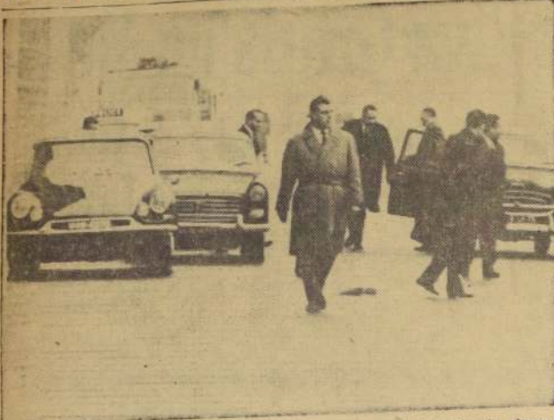
EVIAN, Francia. — Escollidos por miembros del Servicio de Seguridad de Francia, algunos integrantes de la delegación argelina rebelde se dirigen desde sus automóviles hacia los helicópteros, al final de un día de conversaciones. Desembarcando del helicóptero, se ve a MOHAMMED YAZD. Carros de los bomberos y policías están alertas en la guardia.