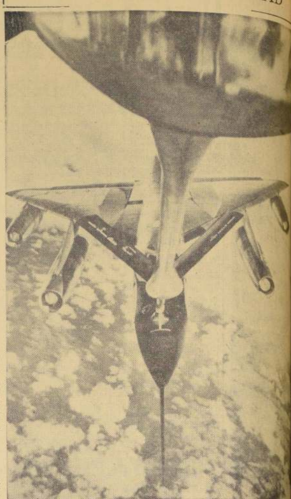
NUEVA YORK. — Dos aviones supersónicos B-58 de bombardero mejoraron su record de velocidad en más de 45 minutos en un recorrido de este a oeste el 3 de presente, en la primera etapa de un vuelo de ida y vuelta a través del continente, superando también tres marcas de velocidad en la aviación. En el grabado aparece el primer jet cuando es reabastecido de gasolina a 50,000 pies de altura sobre el mar y posiblemente la ciudad de Nueva York, antes de emprender el viaje de regreso a Los Angeles. El promedio de velocidad de 1,111 millas por hora.