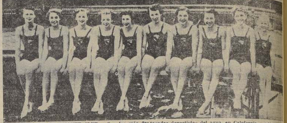
NADADORAS DEL FAIRMONT CLUB. — Son las más destacadas deportistas del agua, en California, y están participando para próximas competencias, que habrán de tener lugar en el Norte de California, a donde irán en representación de su club.