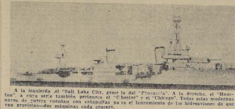
A la izquierda, el "Salt Lake City", gemelo del "Pensacola". A la derecha, el "Houston", a cuya serie también pertenece el "Chester" y el "Chicago". Todas estas modernas naves de guerra cuentan con catapultas para el lanzamiento de los hidroaviones de que van provistas—dos máquinas cada crucero.

WASHINGTON, 25.— (U. P.)—Cuatro modernos y poderosos cruceros de Estados Unidos, con una tripulación total de 2.444 hombres y 211 oficiales, llegarán a Valparaíso en la mañana del viernes, en un crucero de "buena voluntad", a Chile, y en cumplimiento del programa de las grandes maniobras que realiza la flota norteamericana frente a la costa de Panamá. Los cuatro cruceros en cuestión son: el "Chicago" y el "Houston", de la División No. 5 de Cruceros, bajo el comando del contralmirante Thomas C. Hart, y el "Chester" y el "Salt Lake City", comandados en jefe por el contralmirante Henry L. Brinser. El contralmirante Hart como comandante de los cruceros de la Armada de Estados Unidos, será el Comodoro de la flota visitante. El "Chicago", buque insignia del almirante Hart, trae una plana mayor compuesta de 13 oficiales. Su comandante es el capitán R. M. Pawell. El "Houston" tiene una dotación de 10 oficiales. Su comandante es el capitán G. E. Baker. El "Chester" tiene una dotación—incluyendo al almirante Brinser—de cinco oficiales, y está comandado por el capitán H. J. Abbott. El capitán A. L. Faehgar, comanda el crucero "Salt Lake City". Las horas de visita en las naves son de 13.30 a 16.30, durante los días sábado y domingo.