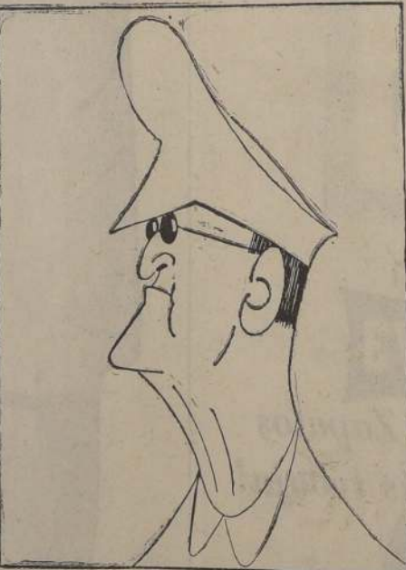
El general Douglas Mc. Arthur, cuyas medidas en Japón tienen al restablecimiento de la libertad y del orden democrático.