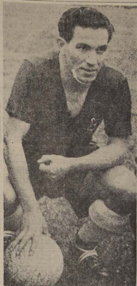
La atracción máxima del fútbol de 1950 la constituyó, sin duda, JORGE ROBLED, el astro del Newcastle, y que significó una poderosa y útil inyección para el seleccionado nacional. Mañana, en el Estadio, se despiden del público local, Robledo y el cuadro internacional.