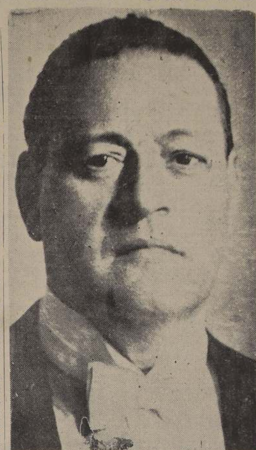
El doctor Roberto M. Ortiz, ex Presidente de la República Argentina, que ha muerto de una bronconeumonía a los veinte días de resignar el Mando

BUENOS AIRES, 15. (U. P.). — A las 7.30 horas de hoy, falleció el ex Presidente de la República Argentina, doctor Roberto Ortiz, víctima de una bronconeumonía.