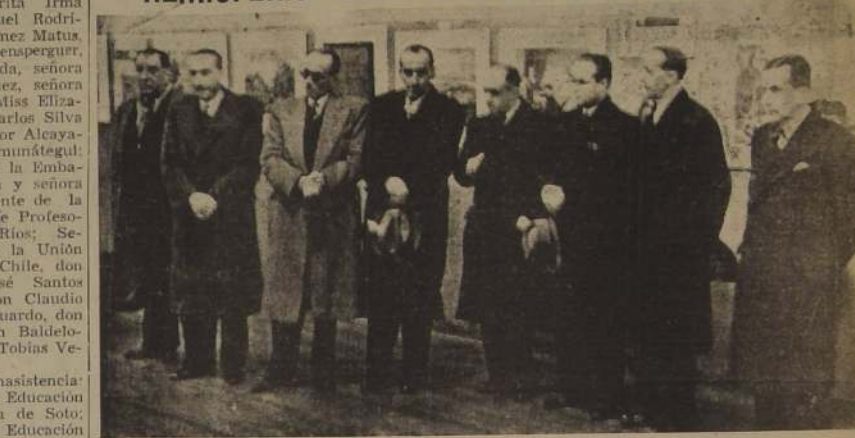
Grupo de personalidades asistentes a la inauguración de la exposición

Ayer se inauguró en la Sala Chile del Palacio de Bellas Artes la Exposición de Arte Contemporáneo del Hemisferio Occidental, acto al que asistió una concurrencia tan numerosa como selecta.