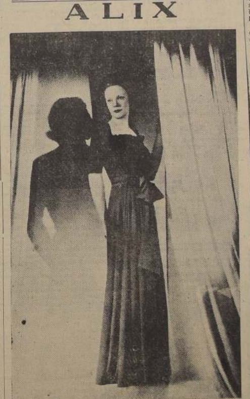
Vestido de noche en crepé marrón, recogido por delante; el cinturón incrustado está hecho en el mismo crepé color habano.

Me refiero a los jabones. Si hay algo feo, incómodo y doloroso, es el jabón. El tratamiento de los jabones es sencillo, pero hay que persistir en él diariamente. Se lavan las manos con agua caliente y buen jabón; se enjuagan con agua caliente y se secan. Se extiende sobre las partes afectadas un