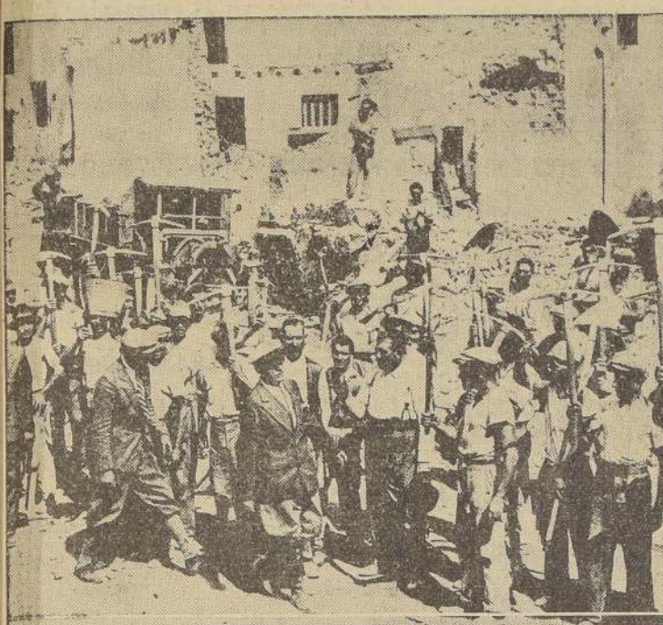
EL PRIMER HOMBRE DE ITALIA, el Duce Mussolini, aparece en esta foto en una de sus poses características, mientras expresa a su Consejo de Estado algunos de sus vastos proyectos.