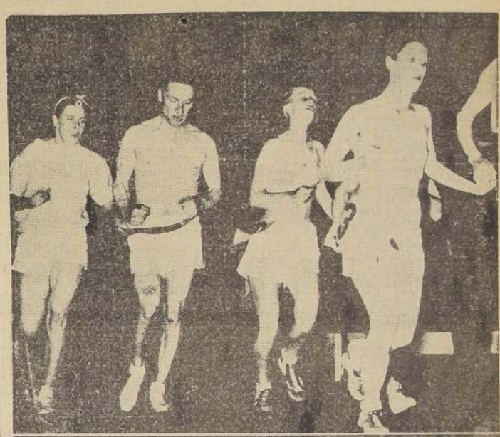
Participantes en una curiosa marathon corrida redonde, e parejas dan y dan vueltas a la pista recientemente en una pista californiana. Los co. hasta que van quedando agotados y eliminados.