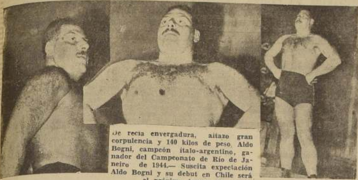
De recia envergadura, altazo gran corpulencia y 140 kilos de peso, Aldo Boggi, campeón italo-argentino, ganador del Campeonato de Río de Janeiro de 1944. Suscita expectación Aldo Boggi y su debut en Chile será el próximo jueves 18

En el prestigioso ring del confortable Teatro Caupolicán se iniciará el próximo Jueves 18