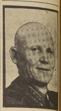
El mariscal Konev

Durante su visita a Estados Unidos, que durará seis sema- nas, seguirán cursos breves de derecho militar en la Uni- versidad de Michigan y en la Northwestern University. Visi- tarán también puntos de in- terés militar, así como lugares históricos de Estados Unidos.