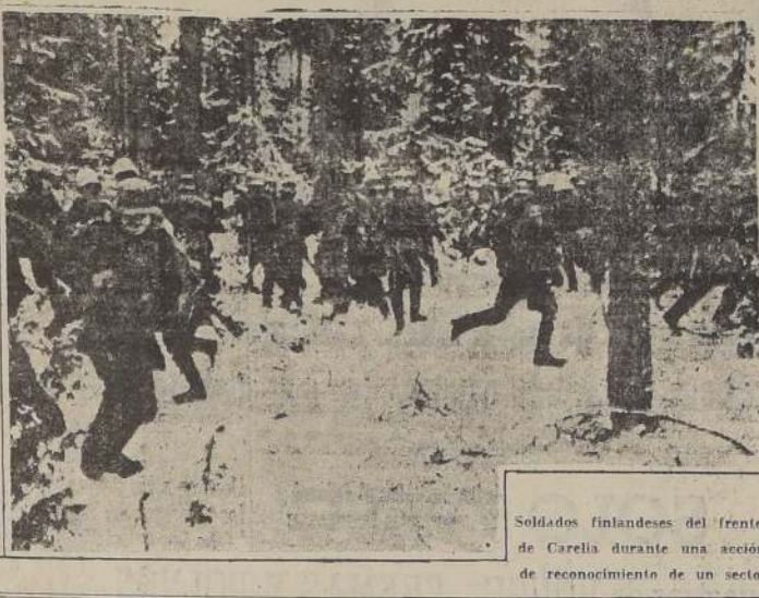
Soldados finlandeses del frente de Carelia durante una acción de reconocimiento de un sector