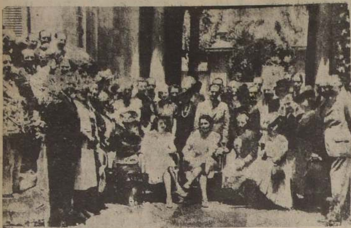
Manifestación ofrecida ayer en la Legación del Paraguay por la delegación de médicos de ese país al Congreso Latinoamericano de Hospitales, a sus colegas chilenos para retribuir las atenciones de que estos los han hecho objeto durante su permanencia en Santiago.