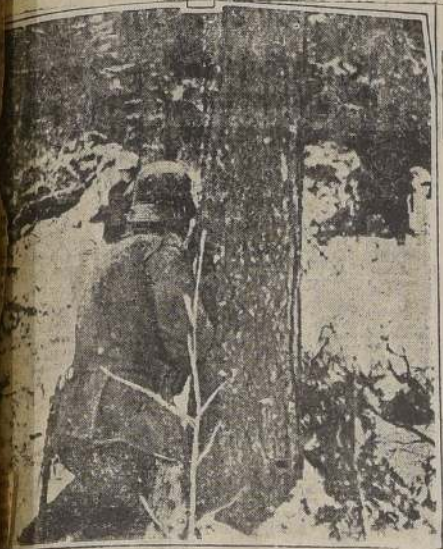
Finlandeses en acecho del enemigo, se protegen detras de un grueso tronco de árbol