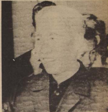
LE DUC THO. De nuevo a negociar

El momento decisivo ha llegado, expresó el diplomático oriental de cabellera plateada. "Es cuestión de resolver rápidamente el problema vietnamita y suscribir el acuerdo o proseguir la guerra. El gobierno norteamericano debe hacer una elección definitiva; la responsabilidad recae plena mente en él".