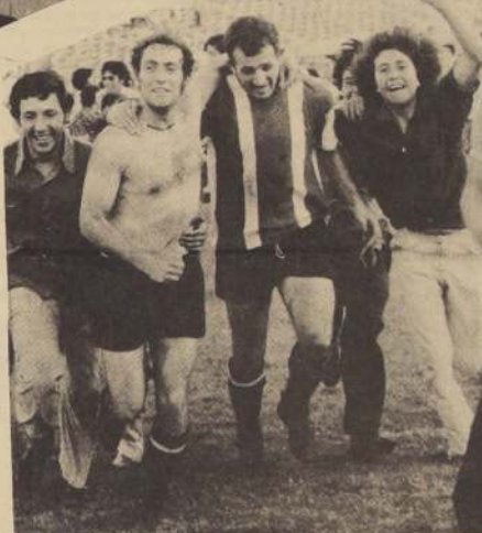
LA VUELTA OLÍMPICA. Los torcos desnudos, el rostro feliz y los hinchas alrededor exteriorizan su alegría.