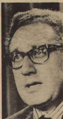
"HARE LO MEJOR QUE PUEDA": Henry Kissinger rumbo a París

Yo quiero que los norteamericanos se imaginaren esto, en las calles de Hanoi, en Manhattan. Comprende cuán difícil es. Pero que prueben. Cuando pretendían hacer la comparación, quizá tengan que tomar en consideración una circunstancia más. La calle Kham Thien es mucho más antigua que las calles de Manhattan. Es mucho más antigua que Nueva York y todos los Estados Unidos de América. Surgió sesientos años antes de que se produjera la guerra de la independencia en América, cuyo 200 aniversario será celebrado en los EE.UU. dentro de tres años y medio. Surgió en Hanoi al mismo tiempo que el antiguo templo de la literatura (que por fortuna aún está intacto). En los siglos doce y trece esta ciudad era residencia de matemáticos, científicos, astrólogos. Quizá, precisamente por esto haya recibido el nombre de Kham Thien, cuyo significado es "Observa el cielo" (APN).