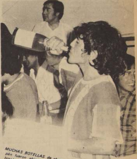
MUCHAS BOTELLAS de champán fueron abiertas para celebrar la victoria.