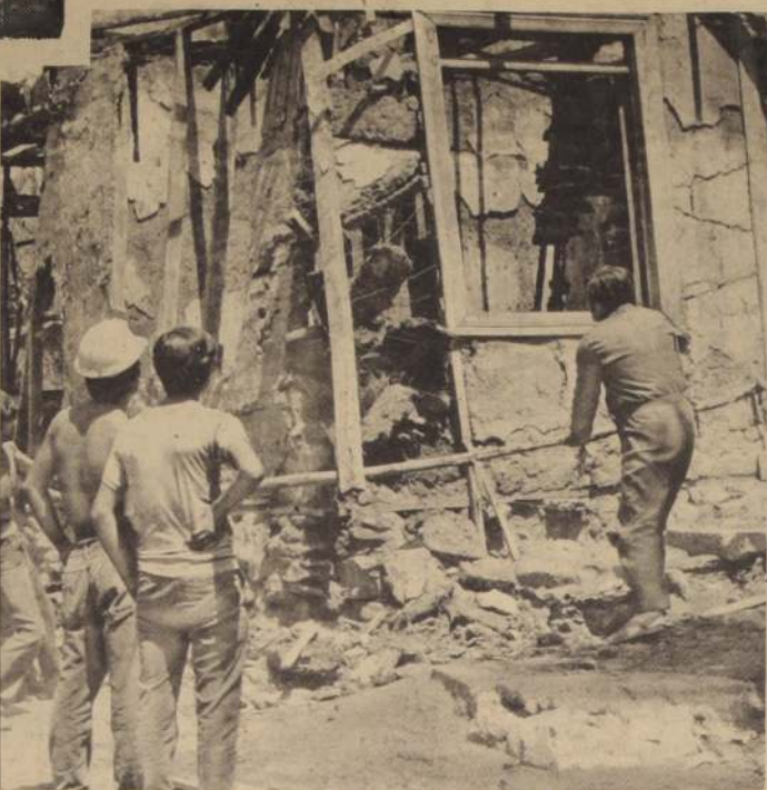
CUADRILLAS DE POBLADORES se encargan de demoler lo que queda de algunas casas, que significan un serio peligro para los pequeños de la población.