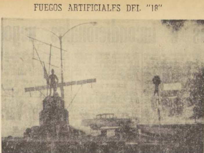
Valparaíso y Viña celebraron el recién pasado 18 en medio de festivales de pirotecnia que hicieron la alegría de niños y grandes. En Viña del Mar, en el Muelle de Vergara, se efectuó un extraordinario espectáculo de juegos artificiales que se tradujo en las Fiestas Patrias viñamarinas pero que por primera vez se hizo a la orilla del mar, antes de realizarse en el estero. En Valparaíso, el espectáculo se presentó en el Parque Italia ante miles de espectadores. En el grabado, un aspecto de este último festival con que culminaron los festejos en nuestra zona.

El 10 de octubre se realizará una Asamblea Provincial, en la cual se discutirá la importancia que tiene la reunión de los directores de las actividades del Ejecutivo, tiene la reunión.