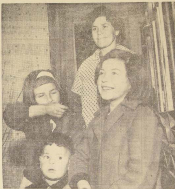
Una debida protección a las necesidades de la familia chilena establece el proyecto de reforma a la previsión social, en su parte referente a las llamadas "Prestaciones Familiares", que tienden a satisfacer, a través de una distribución más justa de los beneficios previsionales, las aspiraciones del núcleo familiar.

sintetizarse en un concepto más amplio de las necesidades del núcleo familiar, en la orientación, fiscalización y dirección de las prestaciones por parte del Estado, y la nivelación de las asignaciones mediante compensaciones.