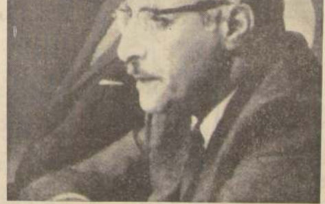
NACIONES UNIDAS.— El nuevo Presidente de las Naciones Unidas, Abdul Rahman Pazhwak, de Afganistán y quien le correspondió la presidencia sin oposición, cargo que este año le pertenecía a Asia, por el sistema rotativo de elección. Junto a él, el Secretario General, U Thant, quien permanecerá en el cargo hasta el 20 de diciembre, sin optar a la reelección. La asamblea inaugural tuvo lugar ayer 20.

Además de Vietnam y la renuncia de U Thant —y el primero está ligado directamente con el segundo, a pesar de los públicos esfuerzos del Secretario General por desligarlos—, los problemas que deberá afrontar la Asamblea siguen siendo los conflictos raciales africanos, especialmente los casos de Sudafrica, Africa del Sudoeste, Rhodesia y los territorios portugueses, junto con los repetidos debates sobre el desarme, el control nuclear y la perenne batalla sobre la representación de China.