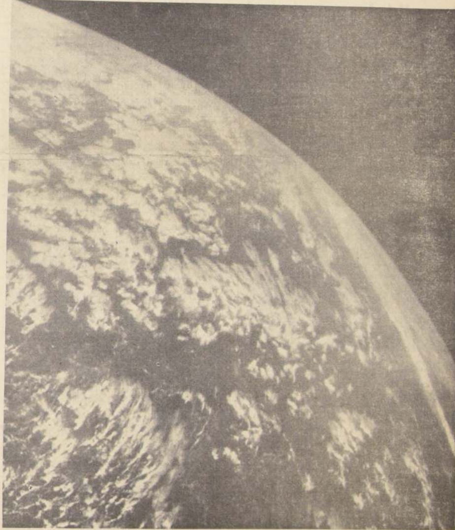
CENTRO ESPACIAL DE HOUSTON.— Esta hermosa fotografía de la Tierra fue tomada durante el vuelo de los astronautas del Géminis-11, desde una distancia de 529 Millas. La fotografía muestra claramente el Océano Índico y parte de la costa de Australia. Se observa con nitidez, pocas veces lograda, la curvatura de la Tierra.