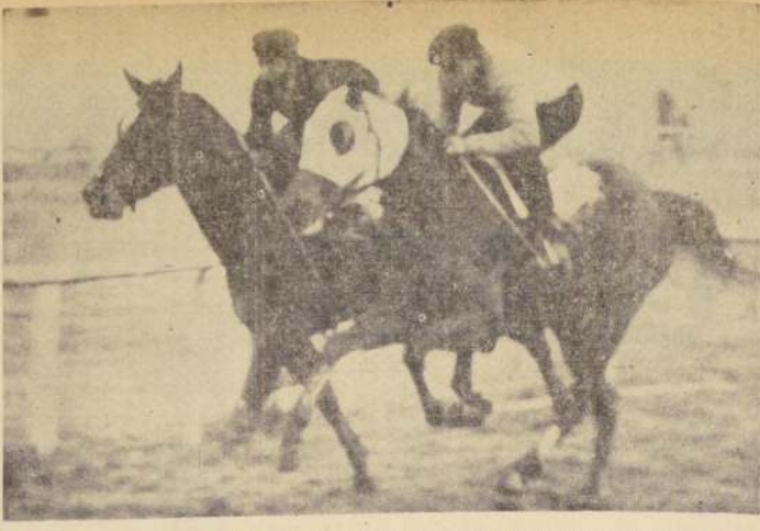
Templario, correrá en el "Juan Antonio Ríos" antes de irse a Estados Unidos. En el grabado, apronta con otro ejemplar en la pista del Hipódromo Chile.