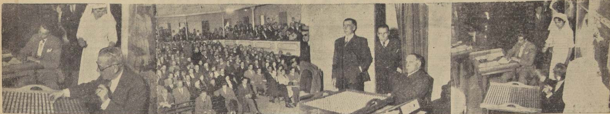
Diversos aspectos del primer sorteo de la Polla de Beneficencia, realizado ayer en el Teatro del Hospicio, ante numeroso público.