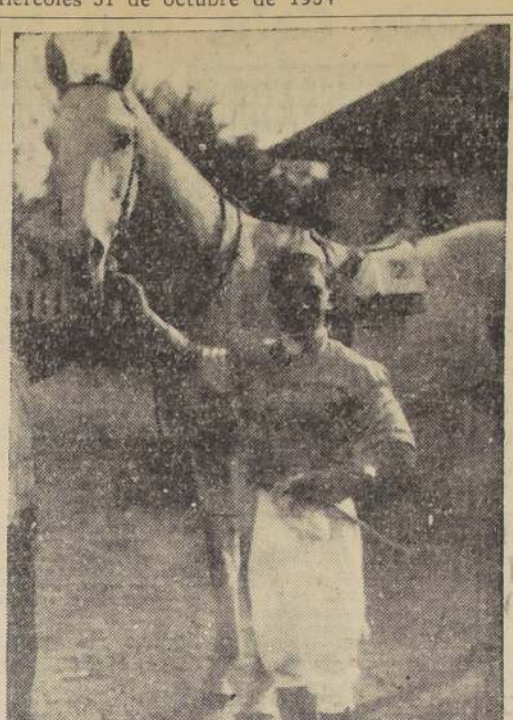
El crack Oakland, que mañana reaparece en el premio Principe de Gales, en donde se le espera un justificado favoritismo

PAGANINI, 47, J. Morales.— Chance destacada, pues pasa por un momento excepcional. SEXTA CARRERA. — 2.400 METROS. — HANDICAP