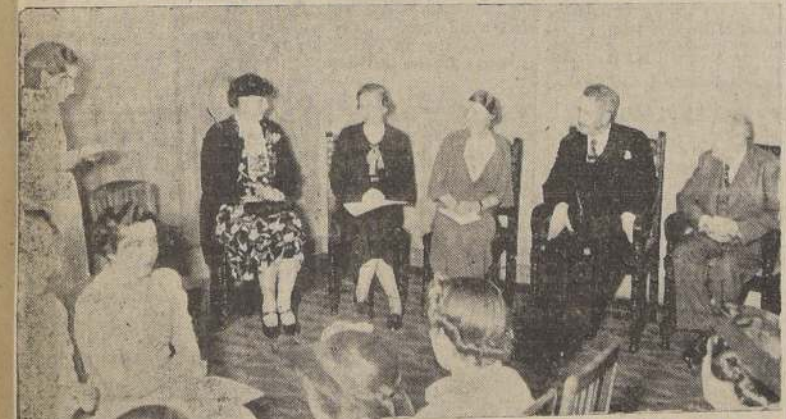
Durante la repartición de diplomas a las alumnas del último curso de la Escuela de Servicio Social "Elvira Matte", acto que se efectuó ayer con asistencia del Ministro de Hacienda, don Francisco Garcés; del presidente del Senado, señor Miguel