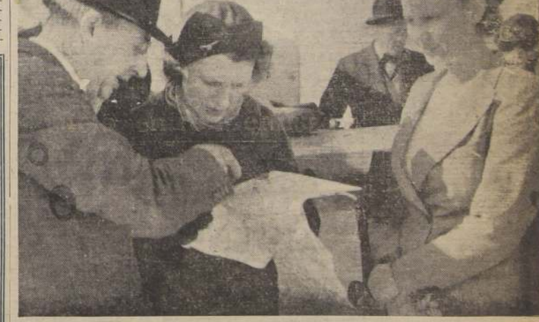
Maryse Bastie, momentos después de llegar a Los Cerrillos, explica la ruta seguida en su raid

A las 7.53 horas de ayer, aterrizó sin novedad en el aeropuerto de Cerrillos la famosa aviadora francesa Maryse Bastie, que realizó por los países de Sud América una gira de propaganda del material de aviación francés, bajo los auspicios del Ministerio del Aire de su país.