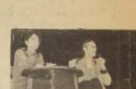
Cia. de los Cuatro, en una escena de "El amor a 12 round", de Durrenmatt.

MAIPO San Pablo 4261 (731982) Desde las 14 hrs. El caballo bayo. Prisionero de la ciudad. Los bandidos.