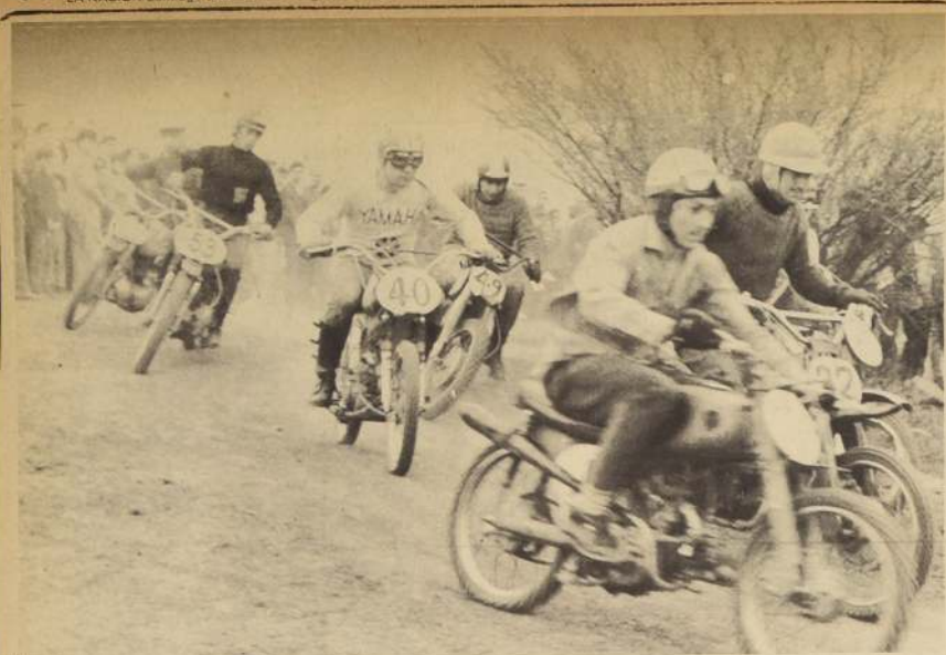
LOS CENTAUROS: motorizados estarán en San Bernardo. Pilotos y máquinas apropiados para terrenos difíciles.