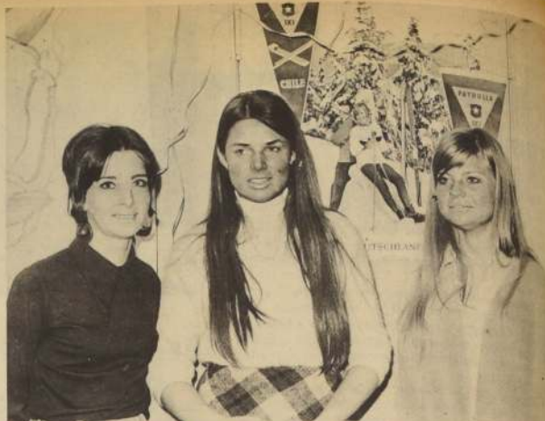
LA BELLEZA JUVENIL de las universitarias, la policroma combinación de colores, cabellos y ojos junto al fondo inmaculado de la nieve, serán un atractivo más del Carnaval que se inicia hoy