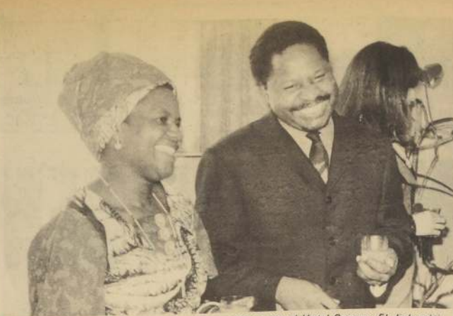
El primer embajador de Zambia ante la Moneda, Ernest Matias Mainza Chona, y esposa ofrecieron una conferencia de prensa en el Hotel Carrera. El diplomático se refirió especialmente a la baja que ha experimentado el precio del cobre en la bolsa de metales de Londres.

El seminario se realizará en la sede de la Universidad Técnica del Estado, en Punta Arenas, y se sabe que participará un grupo de ochenta expertos, además de autoridades locales y nacionales que dominan la materia.