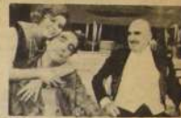
"El Sr. Puntilla y su criado Matti" en el Varas.