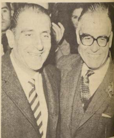
Frei y Tomic los dos grandes líderes populares a quienes la Derecha trata inútilmente de mostrar divididos.

Sin embargo, desde hace años sostengo que es necesario también el concurso de otras fuerzas políticas que, aunque en menor grado que