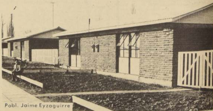
Pobl. Jaime Eyzaguirre

Los Departamentos y Viviendas podrán ser visitados por los interesados los días Sábado y Domingo.