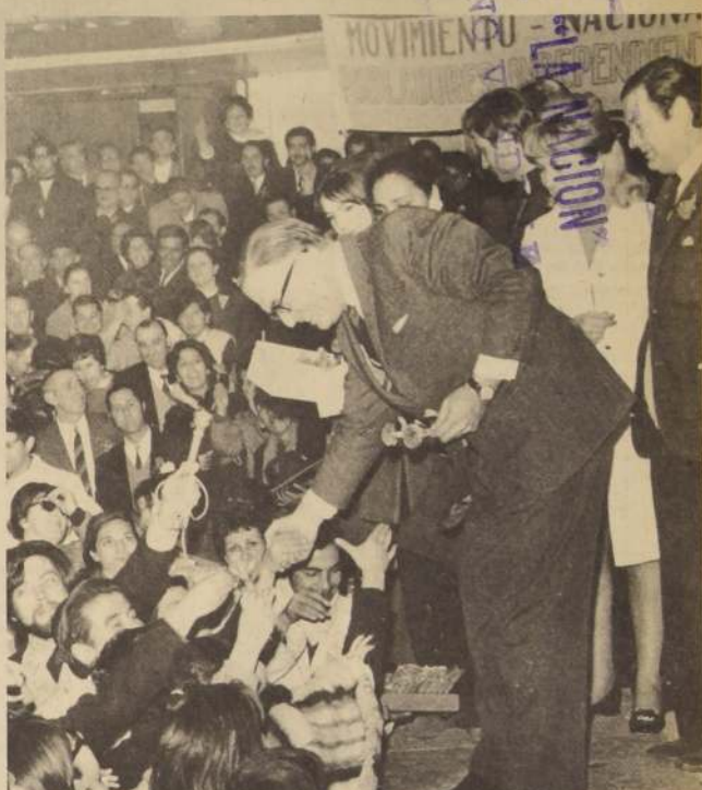
Un compromiso revolucionario selló en la noche del jueves Radomiro Tomic, con el pueblo chileno, reunido en el Teatro Caupolicán a través de los represen- tantes de la comunidad organizada, los profesionales y técnicos jóvenes.