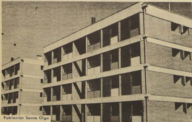
Población Santa Olga

Integrantes de la Nómina Extraordinaria de Prelación del Plan N° 4, N°s 3.001 al 4.007, Sábado 22 de Agosto desde las 9 hrs.