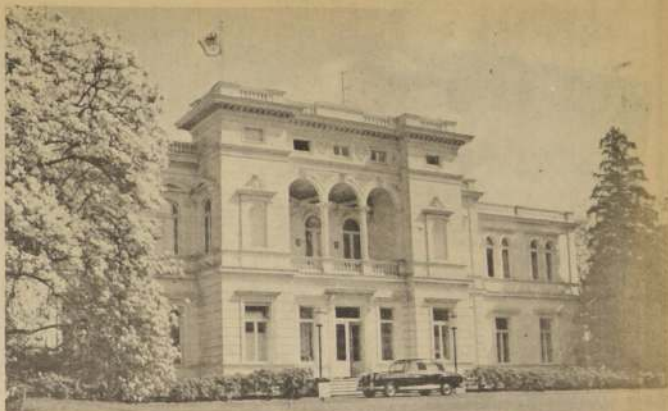
Palacio presidencial de Bonn