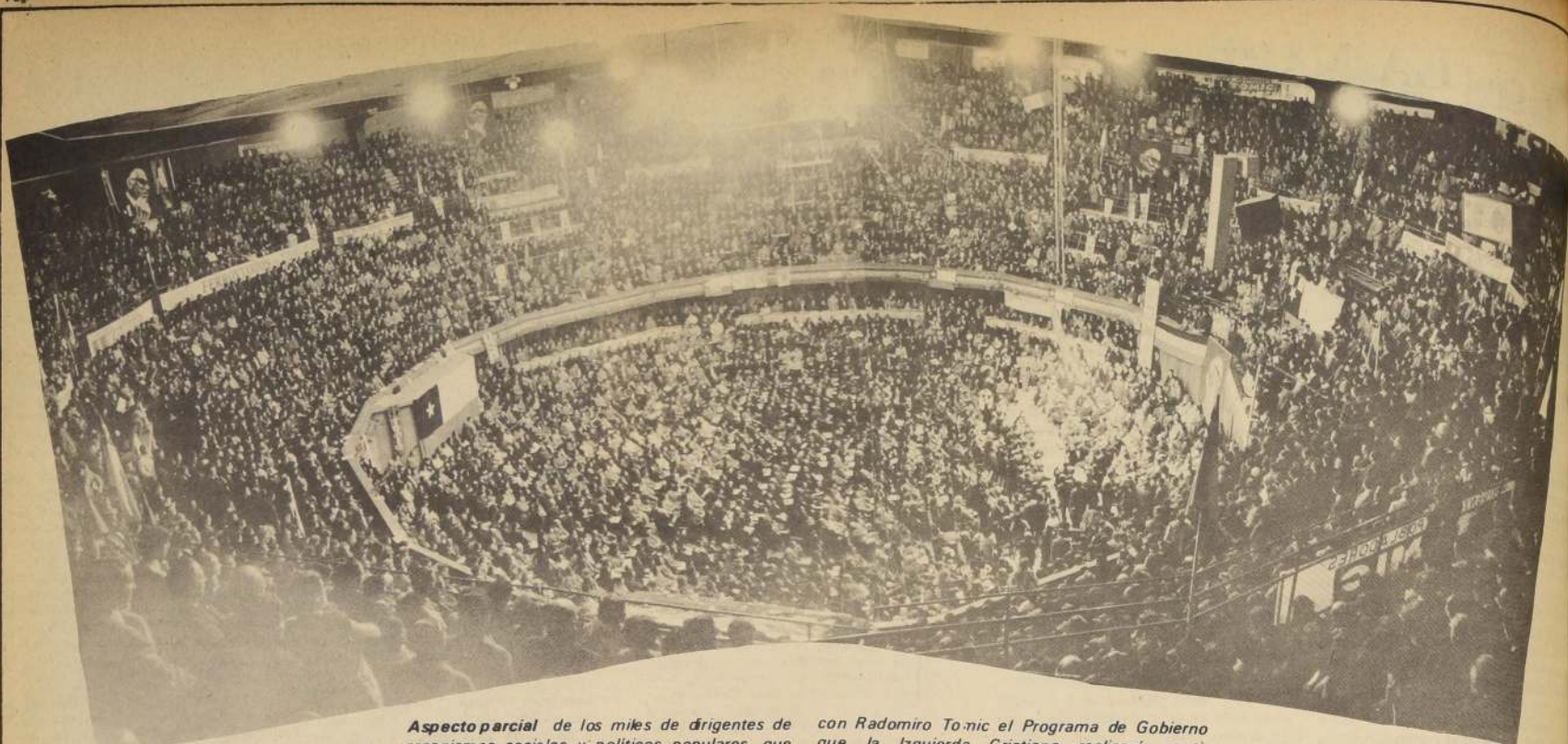
Aspecto parcial de los miles de dirigentes de organismos sociales y políticos populares, que repletaron el Teatro Caupolicán para reafirmar con Radomiro Tomic el Programa de Gobierno que la Izquierda Cristiana realizará continuando la labor del Presidente Frei.

Con la participación de miles de dirigentes populares