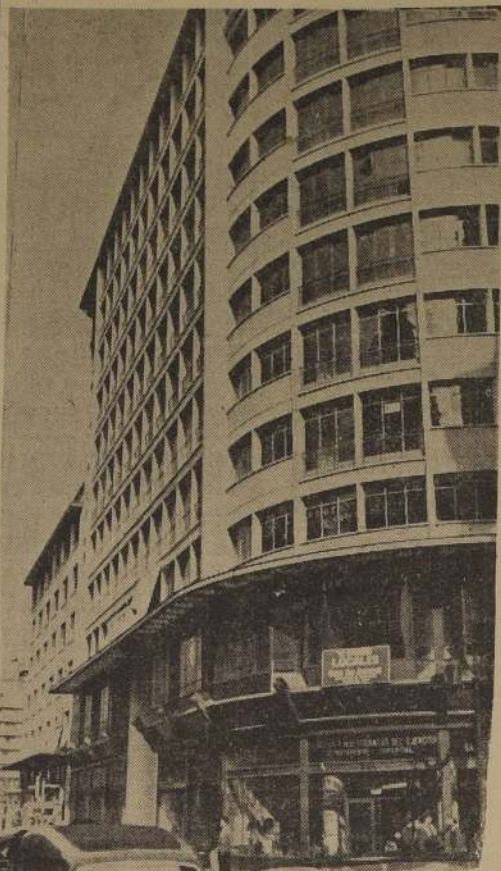
Aspecto del edificio de la Unión Española de Seguros

En calle Moneda esquina de Matías Cousiño se levanta esta construcción — Características de la moderna y novedosa obra arquitectónica