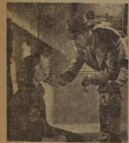
Un rol emocionante tiene Jane Greer en el film R. K. O. "El delito de la venganza".

Jane Greer actúa en emocionante película