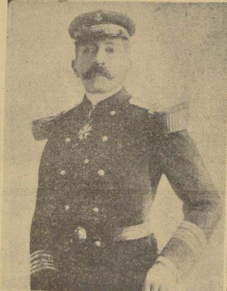
PIERRE LOTI (Julien Viaud), el gran novelista francés, con su uniforme de Comandante del "Vautour" (El Buitre), barco de guerra de su patria, en el que tuvo de teniente a Claude Farrère.

Este hombre dejó en Constantinopla la honrosa fama de "Bir bayuk push dir". Nacido en Charente, de una familia hugonotes, no salió jamás de su casa hasta los doce años.