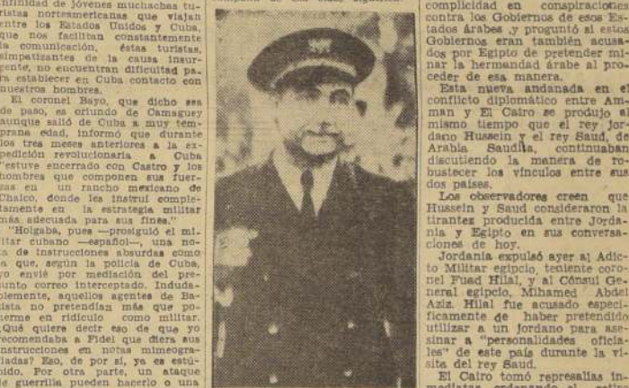
Coronel Alberto Bayo, que instruyó a las fuerzas rebeldes que operan en las sierras.

NEW YORK, 11 (U. P.). En Presidente Fulgencio Batista, tendrá que estar dispuesto a sufrir de 4.000 a 5.000 bajas si emprende una campaña para la liberación de los trabajadores de la Sierra Maestra a las fuerzas rebeldes. Los rebeldes, acudidos por el joven abogado Fidel Castro, según declaró un experto militar especializado en operaciones de guerrilla. Este militar es el coronel de aviación del Ejército Republicano Español, Alberto Bayo, que durante la guerra civil española luchó contra las fuerzas de Franco. Más adelante, a la sazón en poder de las fuerzas rebeldes, Bayo, cuya actividad se desconoce, comentó que el Gobierno de la República Española en el exilio, del cual se encuentra desalligado completamente, no tiene ninguna información sobre el asunto. Según el experto militar, el Gobierno de la República Española acusado hace días por la policía cubana de estar enviando a Castro instrucciones sobre el desarrollo de la guerra, podría ser perseguido por correos personales. Uno de los cuales, según el experto, los agentes del Gobierno cubano, según la policía.