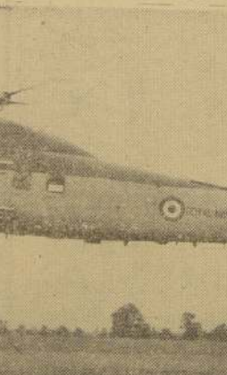
HELICOPTERO BRITANICO DE TURBINA A GAS.— Este es el prototipo del helicóptero Wessex, que realiza un vuelo inaugural propulsado por el motor de turbina "Gazelle". Este es el primer vuelo efectuado en Gran Bretaña en helicóptero propulsado por el motor de turbina "Gazelle". Este es el primer vuelo efectuado en Gran Bretaña en helicóptero propulsado por el motor de turbina "Gazelle".

Lo expuesto demuestra que nuestra sociedad, dispuesta de los medios necesarios para destruir a las ratas, no los utiliza, por lo que las ratas continúan siendo una plaga. Sería de desear que en el mundo entero las autoridades competentes iniciaran sin tardanza y de manera metódica la destrucción de esta plaga de nuestra era.