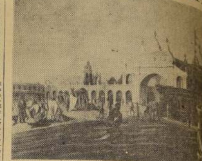
La Gran Plaza de Buenos Aires, a comienzos del siglo (Grabado de Vidal)

PAZ CHILENO-ESPAÑOLA — Se restablecieron completamente las relaciones de paz y amistad entre Chile y España. Habían sido seriamente entorpecidas cuando nuestra patria salió en defensa del Perú, sufriendo todo el peso de la guerra.