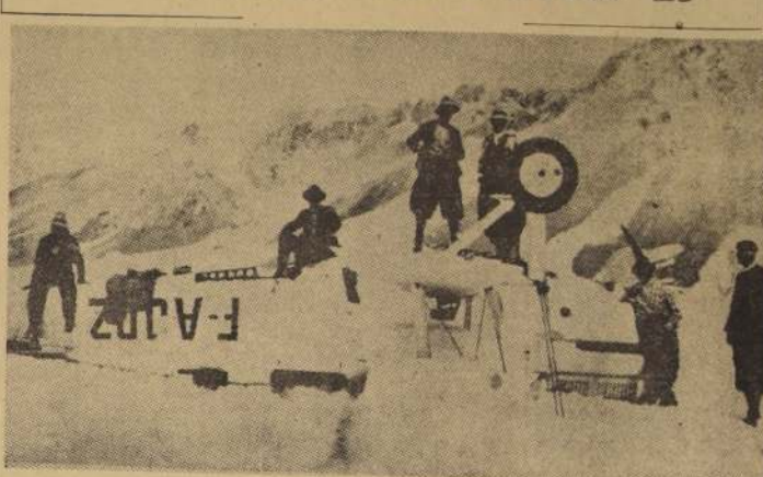
Así fue encontrado el Potez 25 de la Compagnie Generale Aeropostale, que había partido de Los Cerrillos el viernes 13 de junio de 1936. Luego de una intensa búsqueda de ocho días en la cual participaron aviones militares y civiles de Chile y Argentina, el piloto de la máquina Henri Guillaumet fue ubicado herido y desfiliente después de una caminata de cuatro días y cinco noches por la nieve. Patrullas de rescate ubicaron la máquina quince días después. El sitio está cerca de la laguna de El Diamante.