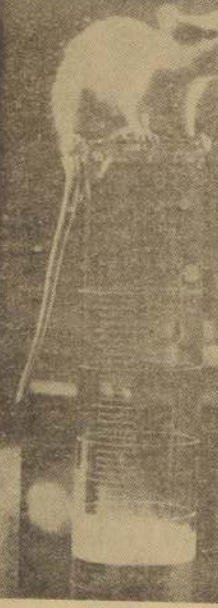
Rata en un laboratorio.

PARIS.— A. F. P.— (Intercontinental).— Al igual que todas las grandes urbes modernas, París declara su guerra anual a las ratas al comienzo de la primavera. Así, durante un mes, los servicios competentes tratan de destruir a los roedores con modernísimos medios.