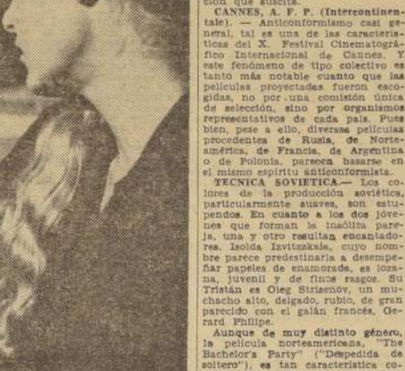
Melina Mercouri y Pierre Vannex, en el film de J. Dassin "Celui qui doit mourir" (El que debe morir).

CINE ARGENTINO. — También la película argentina "La casa del Ángel", de Leopoldo Torre Nilsson, es una diatriba. Esta cinta aboga en contra de los prelatos, de la tiranía de los padres, de los excesos de una educación religiosa demasiado rigurosa, etc.