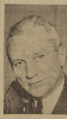
General Frank Maxwell Andrews

WASHINGTON, 4.—(U. P.)— Por primera vez desde la invasión de las Salomón en agosto del año pasado, fuerzas norteamericanas ampliaron sus bases en el extremo suroccidental de ese archipiélago con la ocupación de las islas Russell. Las fuerzas norteamericanas llegaron allí en febrero, después de vencer a los japoneses en Guadalcanal. El comunicado del Departamento de Marina que dio a conocer la acción, no reveló qué fuerzas norteamericanas participaron, pero cabe recordar que era cosa sabida que las tropas del ejército comprendían la mayoría de las que estaban en Guadalcanal. La ocupación de las islas Russell da a los norteamericanos bases a menos de 100 kilómetros de las más próximas posiciones japonesas; las islas Russell tienen grandes plantaciones de cocoteros que eran explotadas por intereses norteamericanos.