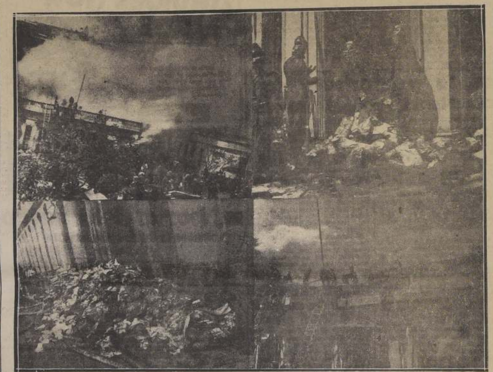
Incendio destruyó totalmente Depósito de la Sucursal 3 de la Caja de Crédito Popular, ubicada en Avenida Argentina esquina Pasaje Juan Bosco.— Las pérdidas alcanzan alrededor de 9 millones de pesos

Ayer mismo se informó ampliamente a la Dirección General del servicio, respecto a las consecuencias de ese gran incendio.