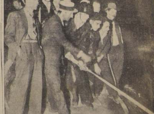
Los bomberos, secundados por el personal de la administración del San Cristóbal y vecinos trabajan en la extinción del incendio de ayer en dicho paseo

La cercanía del fuego enfureció a los animales del Zoológico. — Después de dos horas, el incendio fué dominado