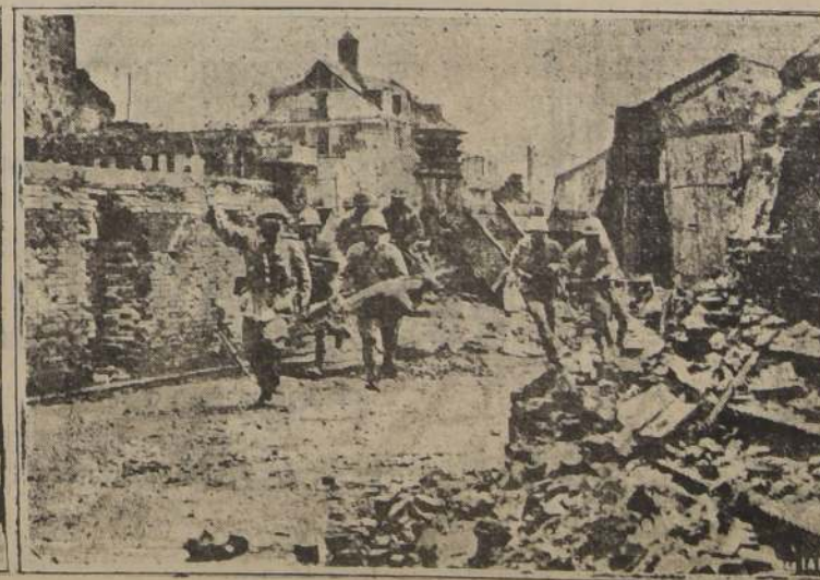
Soldados de marinería de desembarco japoneses, en una carga en el frente de Shanghai