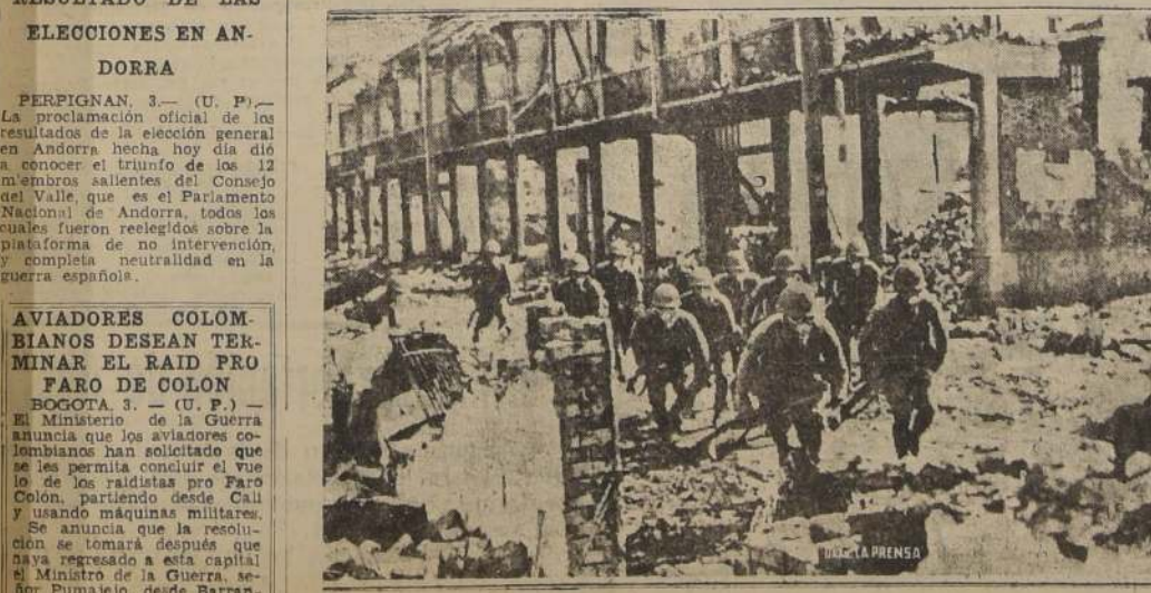
Tropas japonesas, con máscaras contra los gases, efectuando una carga a través de las ruinas de un suburbio de Shanghai

"Por lo demás, el tenor del discurso es exactamente igual al que Roosevelt pronunció en Chicago, y que en esos días suscitó la esperanza, en Inglaterra, de que se produciría una fase más activa de la política internacional de Estados Unidos, esperanza que dio lugar a una profunda decepción en la conferencia de Bruselas."