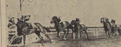
Star Diamond domina a Pilcaniyen, Antu y Edgar Poe, en el clásico "Agustín R. Edwards"

En la cuarta carrera, La Intrusa se impulsó con subido sport. Puestos en acción, Maiza estuvo en la delantera durante las primeras distancias, pero luego La Intrusa se posesionó del puesto de avanzada, asediada por la de Muñoz, con Bayoneta y Calatayud en su